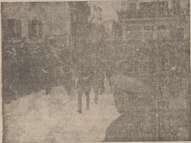
Hacia el desfile

El día, cual sintiendo, como nosotros sus compañeros algo de nostálgica tristeza, por la ausencia de los caídos, amaneció triste y gris, y a momentos, hasta llegó a verter ligeras lágrimas que cesaban al momento, como si los cielos se avergonzaran de demostrar su emoción.