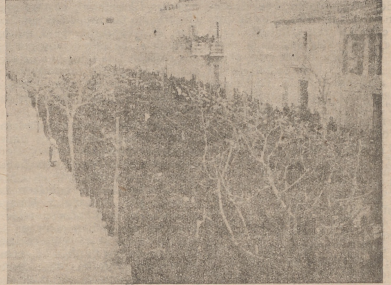
Un aspecto de la formación durante la misa de campaña.

«Falange desea la unión de todos los buenos españoles y su salud, el brazo en alto y la mano extendida es sólo el primer tiempo del abrazo cordial con que