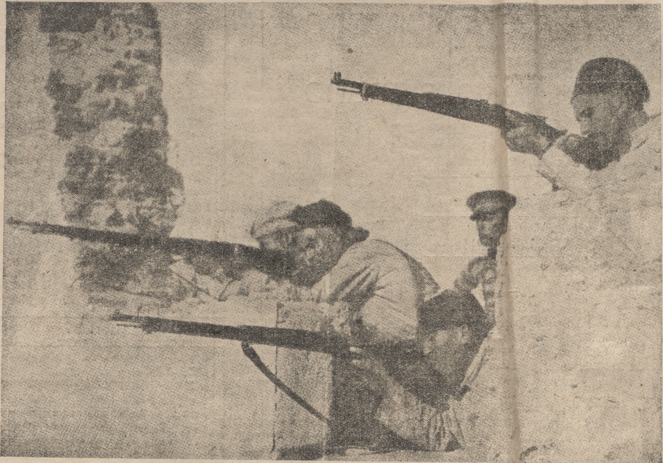
Regulares, en el avance sobre Madrid, disparando sobre las posiciones enemigas.

Estaremos siempre alerta, dispuestos con claridades meridianas y duras exigencias a despararramar por toda Mallorca nuestras normas renovadoras y nuestro ideario sublime, que es el de hacer que España sea Una, Grande y libre ahora y siempre.