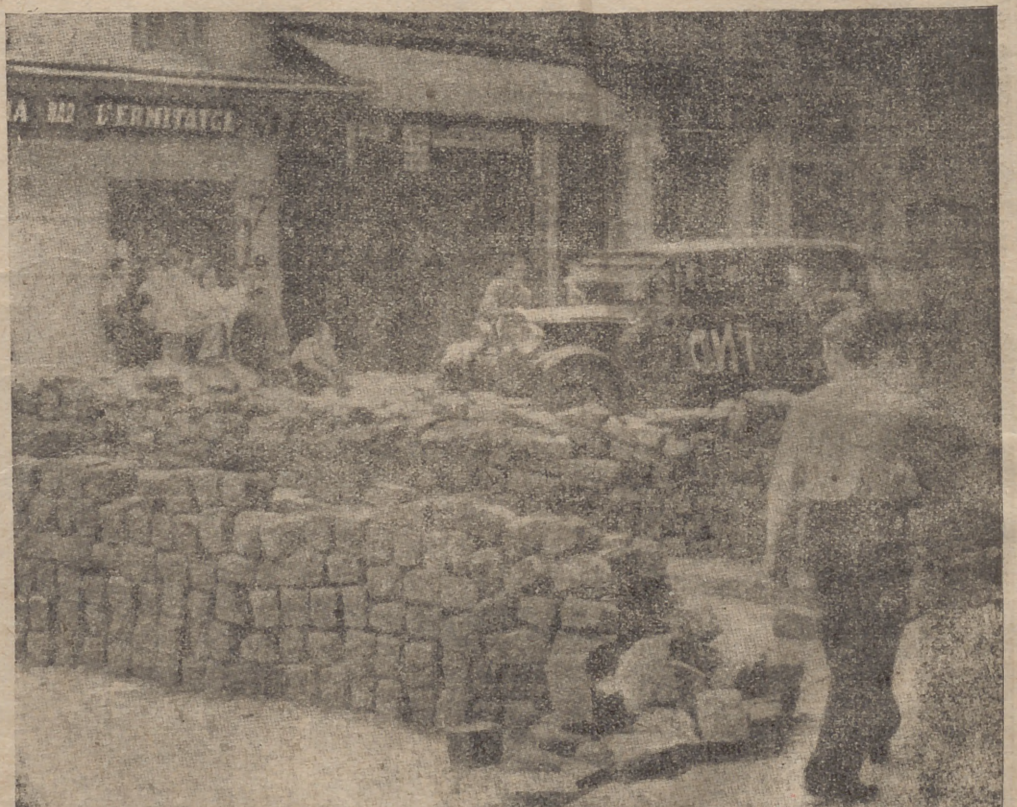
Madrid. La villa del Oso y del Madroño, tiene sus calles convertidas en una enorme trinchera.