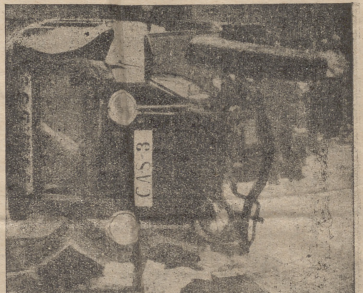
Lo de todos los días. Mienten tanto que hasta a los suyos les está vedado el conocer la verdad. Este auto rojo se internó en nuestras líneas avanzadas sobre la capital de España.