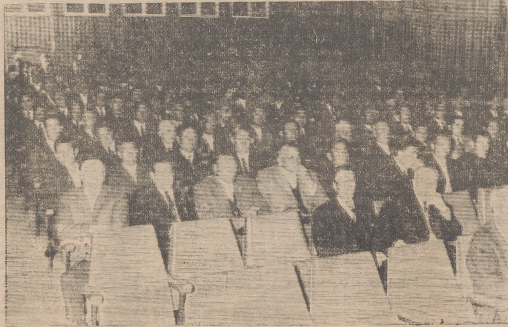
Un aspecto de la sala durante el acto.

Asimismo informó que nuevas cooperativas comercializaron el pasado año por valor de 386 millones de pesetas y se distribuyeron abonos por más de 39 millones de pesetas. Hablo a continuación de la conveniencia de crear Cajas Rurales porque las cajas existentes ya tienen 17 millones y