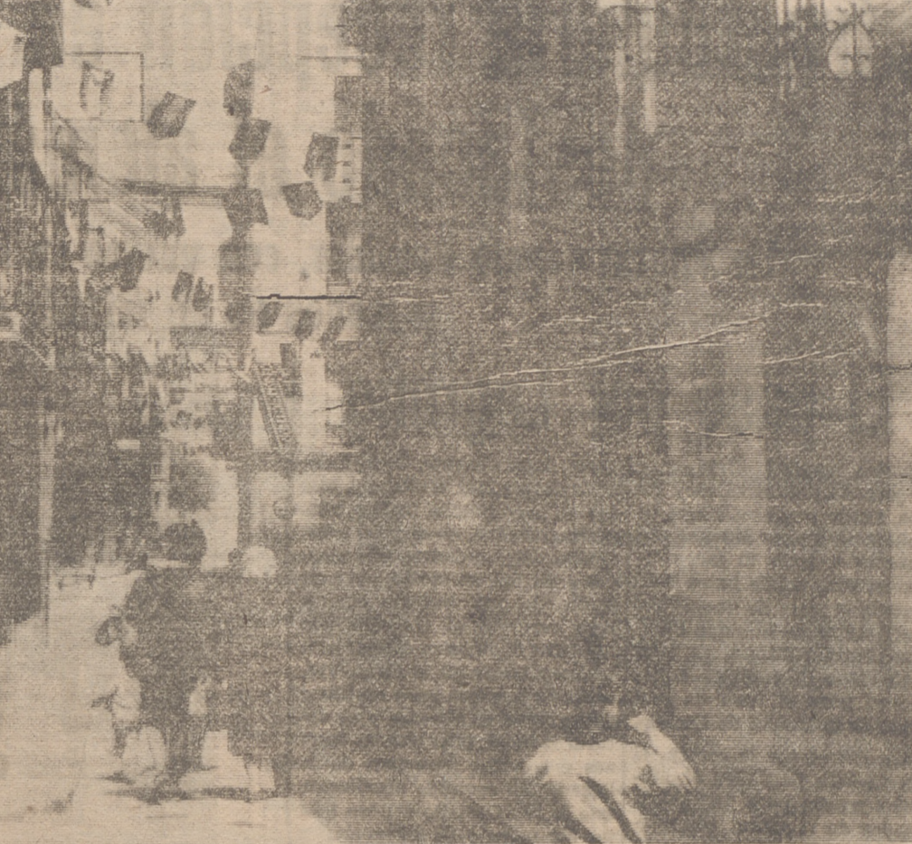
Una de las bonitas calles de Santo Domingo.

las doncellas. Es una chica de 17 años, sonriente y feliz, con ganas de divertirse, a la que hablando de fiestas se le ponen los ojos redondos de alegría.