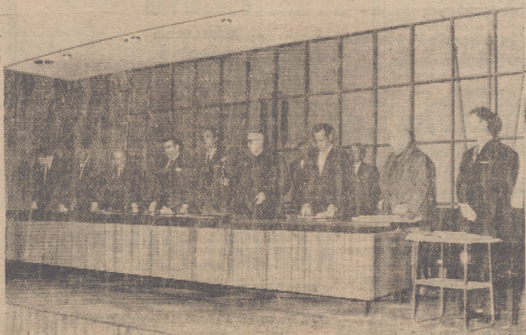
La presidencia, en la sesión de trabajo. (Información en página)