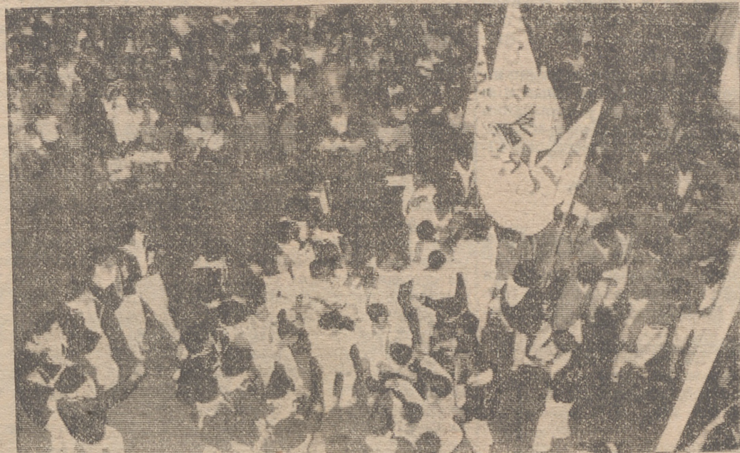
Las "peñas" supusieron una parte importantísima de la alegría en nuestras últimas fiestas.

Posible festival cómico-taurino para recaudar fondos