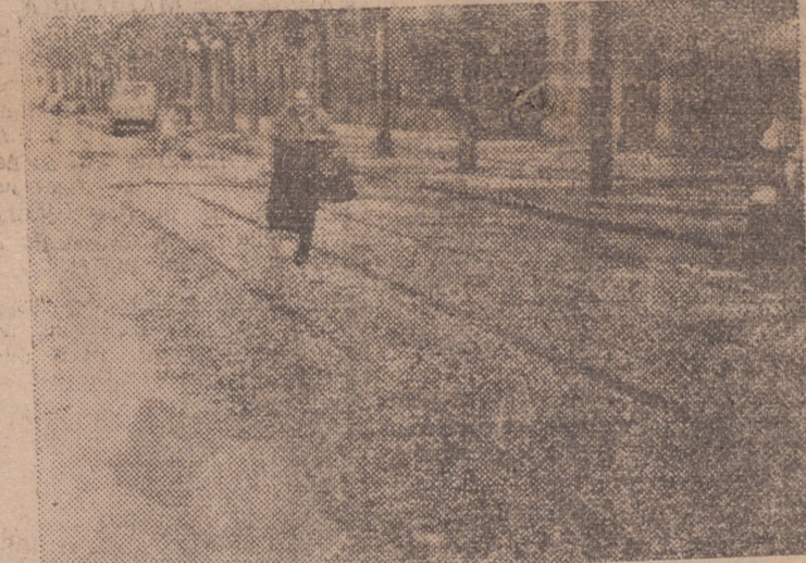
El domingo, además de llover, cayó sobre Logroño una potente granizada. Las calles de la capital aparecieron como nevadas durante algún tiempo. He aquí un aspecto de la Avenida de Navarra después de la tormenta.