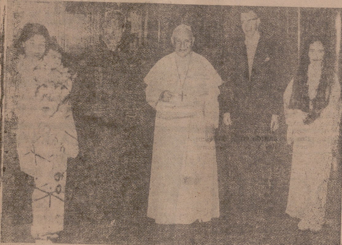
Dentro de la intensidad del pontificado de Su Santidad Juan XXIII destaca su plan de unidad entre las Iglesias y no fueron pocas las personalidades destacadas de otras religiones que se acogieron con marcado interés esa inquietud del Gran Vicario de Cristo, promotor del Concilio Ecuménico. En los primeros días del mes de agosto de 1962 concedió una audiencia privada al gran sacerdote sintoísta Sibiruka Matsubera, que aparece en la foto con su familia, junto a la venerable figura del Santo Padre que acaba de fallecer.

Para hablar con el Director marque Ud. el 1933