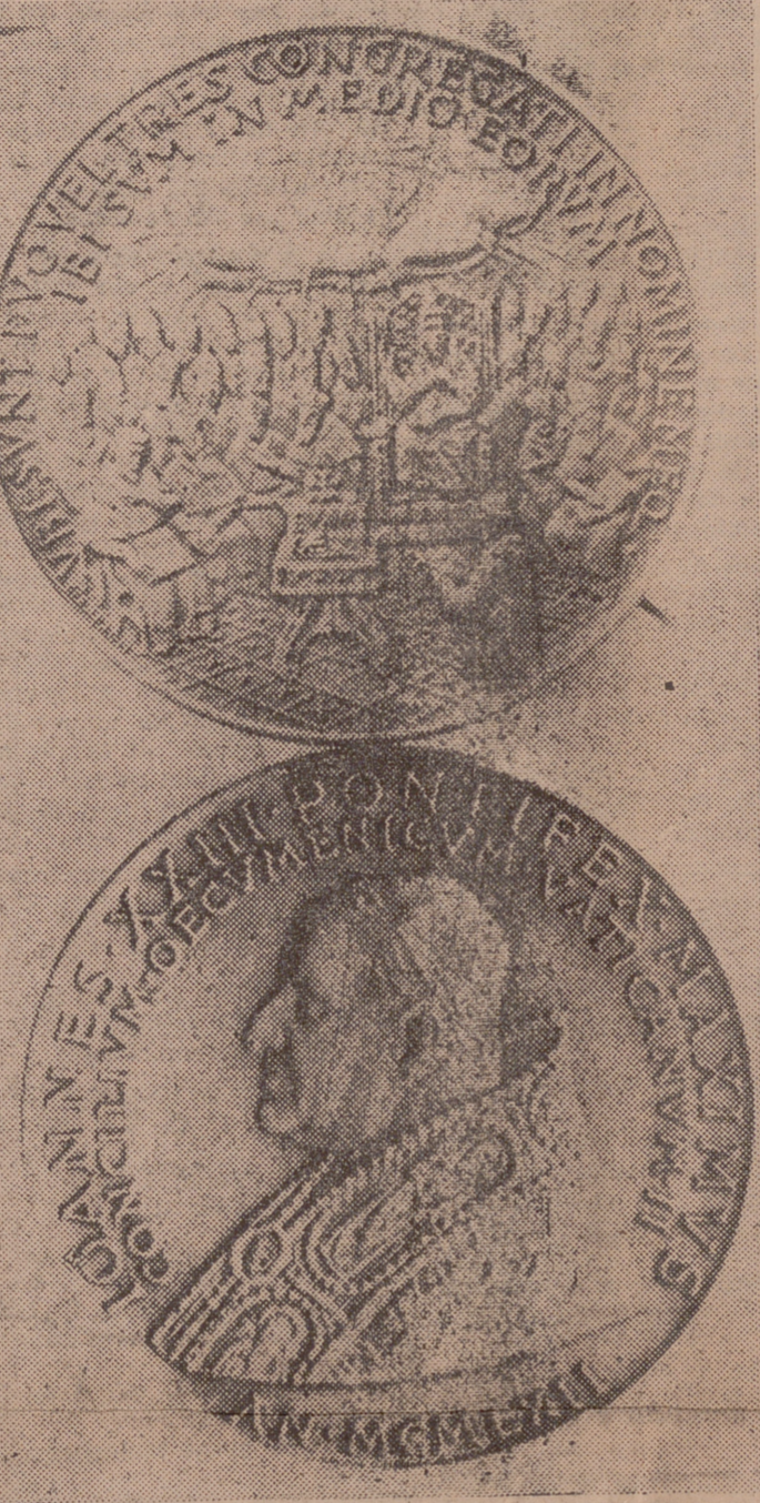
Adverso de la Medalla Conmemorativa del II Concilio Vaticano.

neras y su humor. Sus discursos en las audiencias, lo mismo que sus acciones en público, demostraron su gran deseo de llegar al corazón del pueblo. Le gustaba mucho intercalar en sus conversaciones refranes.