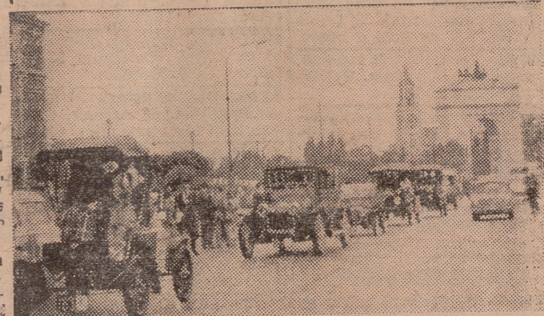
Toman parte en él medio centenar de vehículos, todos ellos de la época de primeros de siglo. Este "Raylle" ha sido organizado por el Club Car de España. En la foto podemos ver un aspecto de la salida de Madrid.