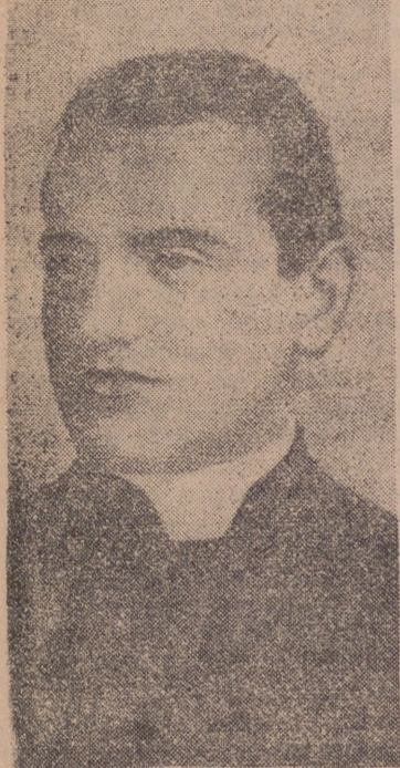
El sacerdote Angelo Giuseppe Roncalli durante los años en que nadie podía prever la grandiosa misión que Dios le tenía preparada.

Como al ser elegido Sumo Pontífice contaba 78 años de