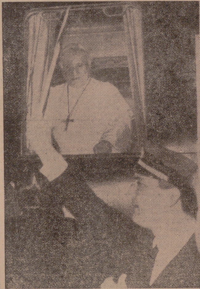
Ver a un Papa viajando en tren no resultaba corriente hasta que Su Santidad Juan XXIII comenzó a utilizarlo para dirigirse al Santuario de Loreto, en representación de todos los santuarios del mundo.

Monseñor Radini-Tedeschi estaba a la cabeza del movimiento, ayudado por la amistad y estima del Papa Pio X, pero algunas veces tropezaba con la oposición de otras tendencias en la Iglesia italiana y en el Vaticano.