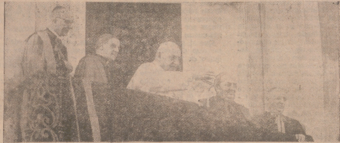
CASTELGANDOLFO. — S. S. Juan XXIII, desde el balcón principal del palacio veraniego, imparte su bendición a los millares de peregrinos y habitantes de esta ciudad que acuden a recibirle.