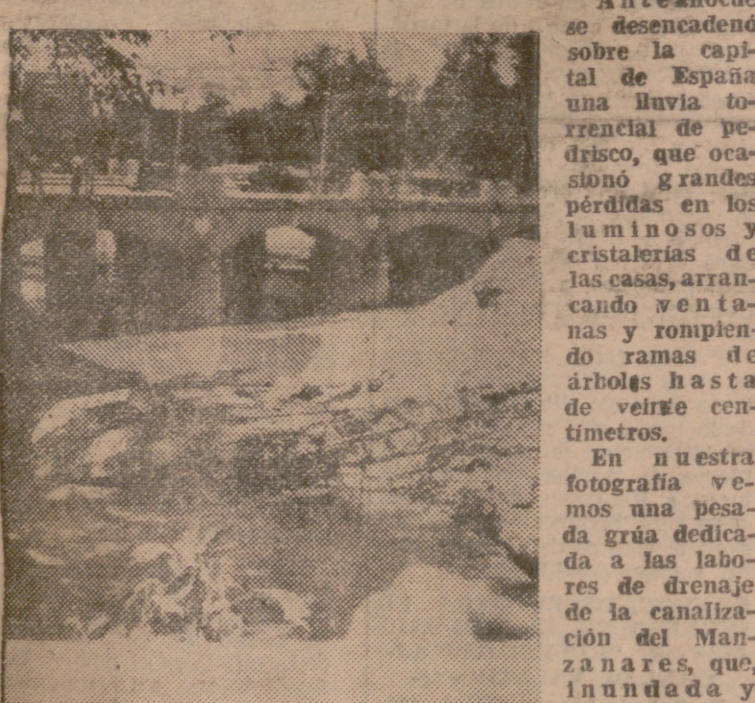
rompieron la margen derecha, donde ésta se encontraba situada, empujó a la misma al lecho del río, colocándola en la difícil situación en que aparece fotografiada.

Anteanoche se desencadenó sobre la capital de España una lluvia torrencial de pedrisco, que ocasionó grandes pérdidas en los luminosos y cristalerías de las casas, arrancando ventanas y rompiendo ramas de árboles hasta de veinte centímetros. En nuestra fotografía vemos una pesada grúa dedicada a las labores de drenaje de la canalización del Manzanares, que, inundada y arrastrada por las aguas, que