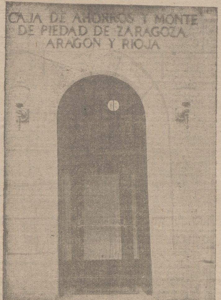
Fachada de la Agencia de la Caja de Ahorros y Monte de Piedad de Zaragoza, Aragón y Rioja, inaugurada en Cenicero.