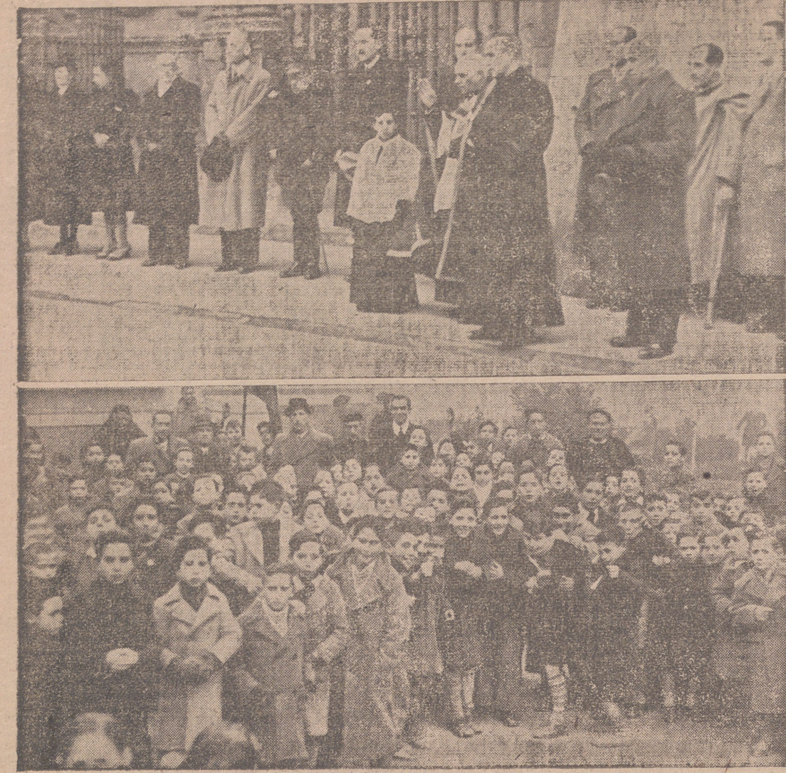
El domingo se celebró en toda España el homenaje a los niños de la esposa del glorioso General Moscardó, como figura señera de las madres españolas, que ha sabido alimentar el fuego patriótico e inspirar el más sublime heroísmo en su hogar, ese heroísmo de que dieron fe con sus vidas los hermanos Luis y José Moscardó.

EN LA IGLESIA DE PP. ESCOLAPIOS Inauguración de un bellissimo Altar Mayor