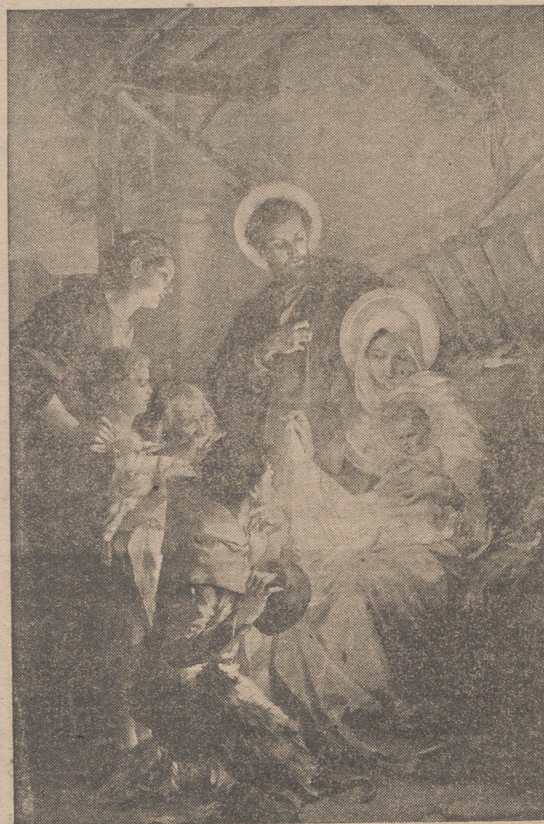
"Dijo el Angel a los pastores: Hoy os ha nacido en la ciudad de David el Salvador, que es el Cristo o Mesías, el Señor Nuestro. Y sirvaos de señal, que hallaréis al niño envuelto en pañales y reclinado en un pesebre."