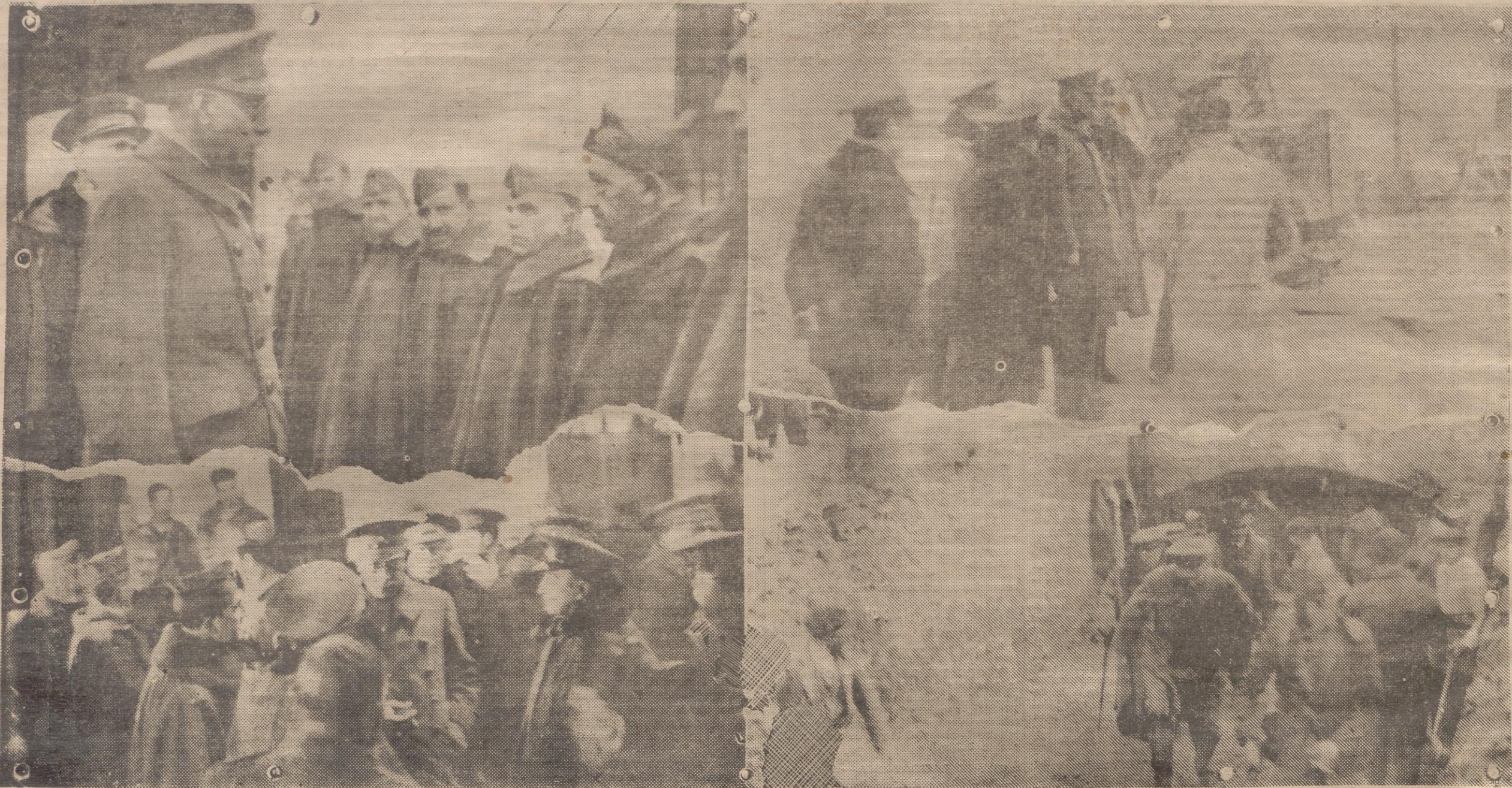
DE LA VISITA A LOGROÑO DEL HEROICO GENERAL MOLA, JEFE DE LOS EJERCITOS DEL NORTE. — EL INVICTO CAUDILLO EN SU VISITA A LOS CUARTELES DE INFANTERIA Y ARTILLERIA Y A LOS REFUGIOS CONTRA AVIONES QUE SE CONSTRUYEN EN EL SOLAR DE COVARRUBIAS