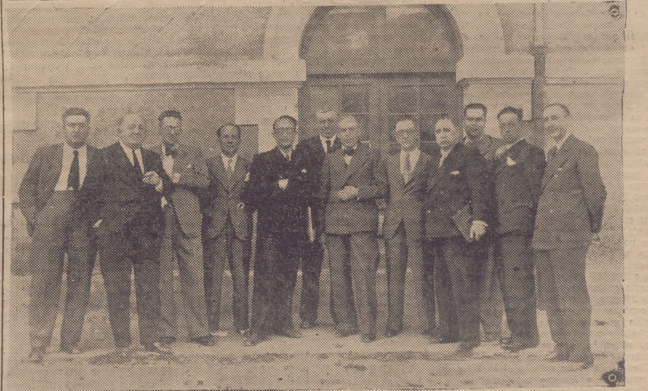
GRUPO PRESIDENCIAL DE LA ASAMBLEA MEDIO DE MIRANDA DE EBRO, A LA QUE ASISTIERON REPRESENTANTES DE BURGOS, LOGROÑO, SANTANDER, ALAVA, VIZCAYA, GUIPUZCOA Y NAVARRA, Y EN LA QUE SE ACORDO PEDIR QUE LA SANIDAD SEA FUNCION NACIONAL.