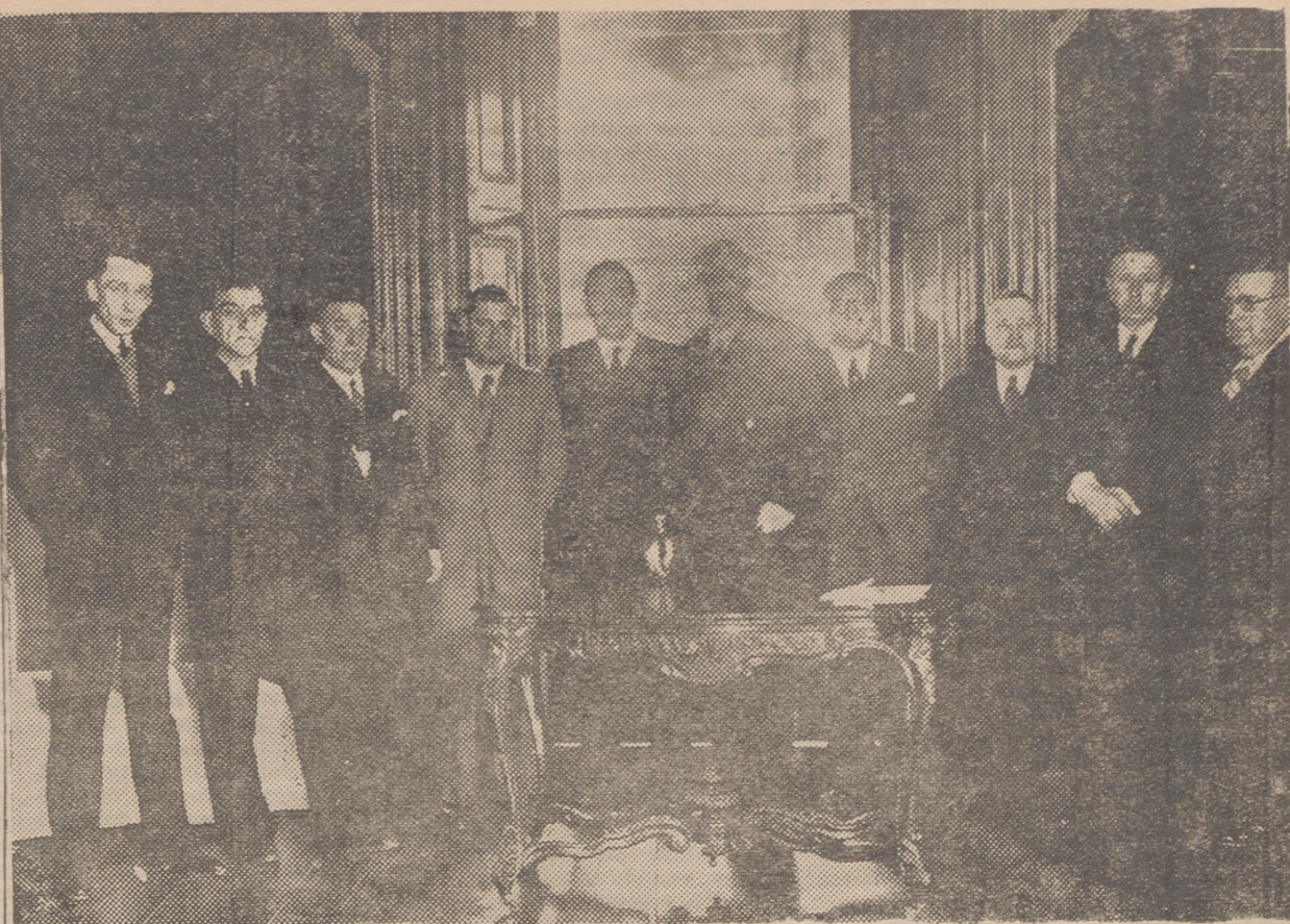
EL GOBERNADOR CIVIL Y LOS NUEVOS GESTORES PROVINCIALES, DESPUES DE LA TOMA DE POSESION