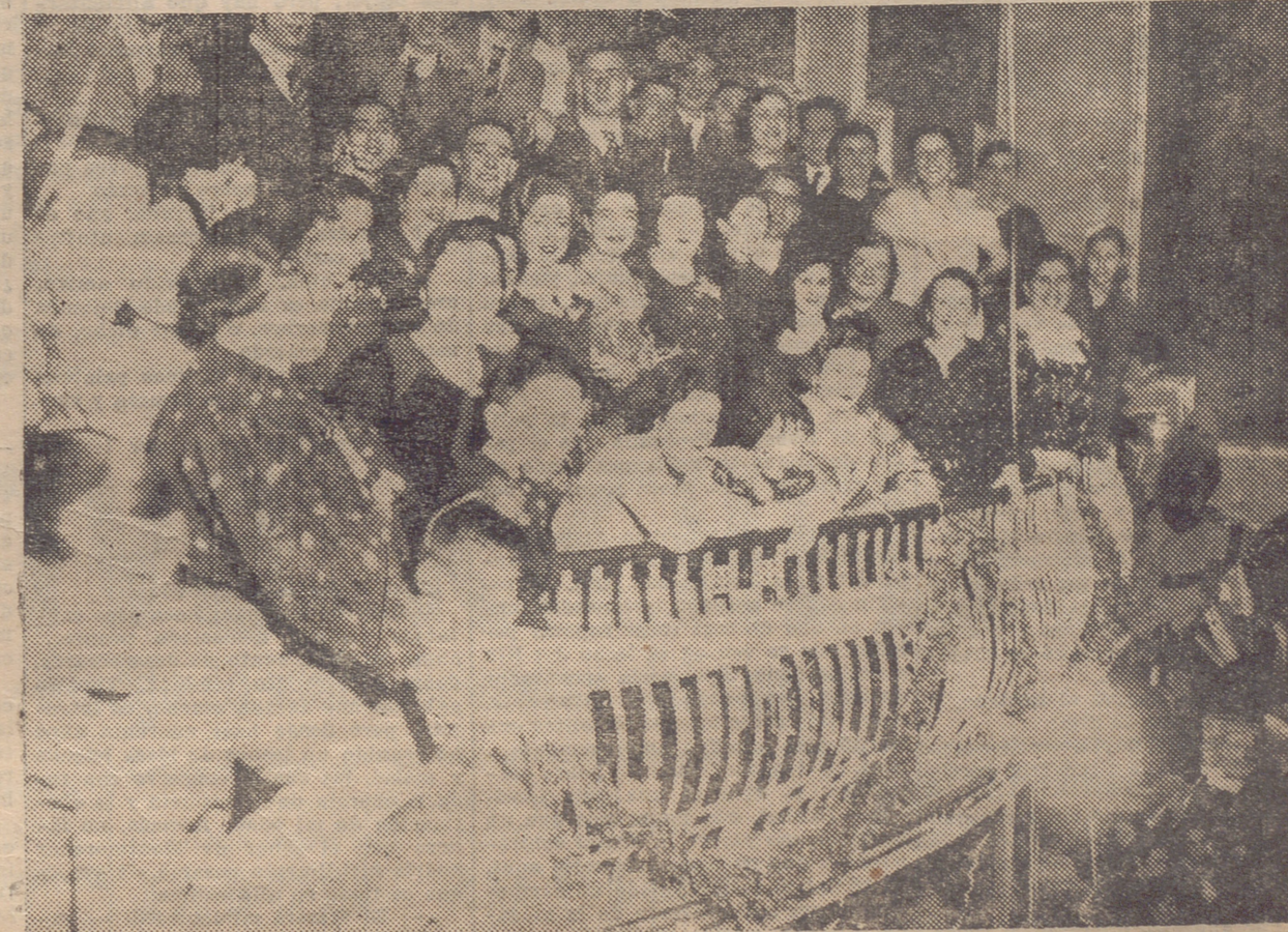
DEL BAILE DE PIÑATA DEL GRAN CASINO.—ASPECTO DE UN PALCO DEL TEATRO BETI-JAI