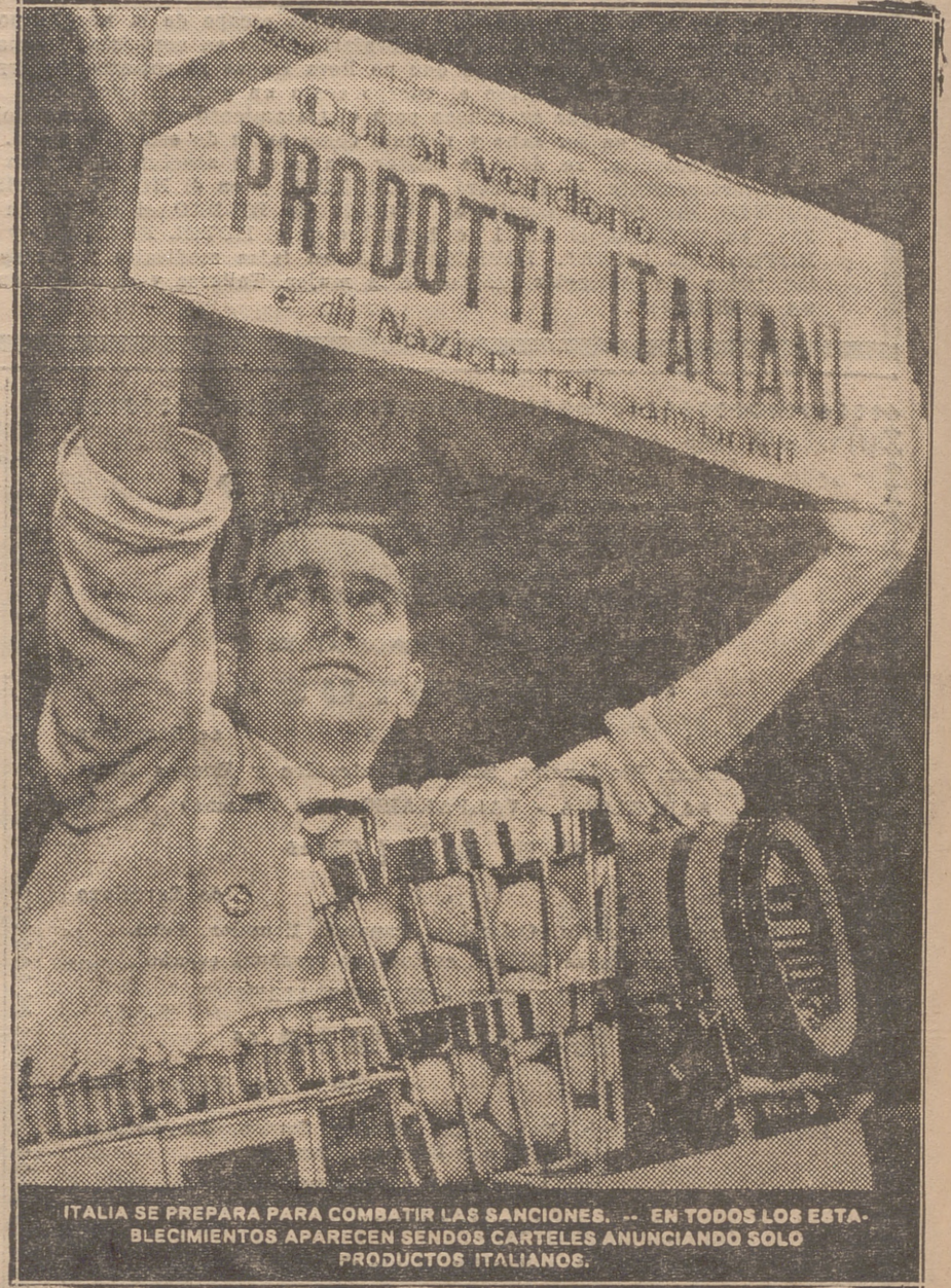
ITALIA SE PREPARA PARA COMBATIR LAS SANCIONES. ... EN TODOS LOS ESTABLECIMIENTOS APARECEN SENSOS CARTELES ANUNCIANDO SOLO PRODUCTOS ITALIANOS.