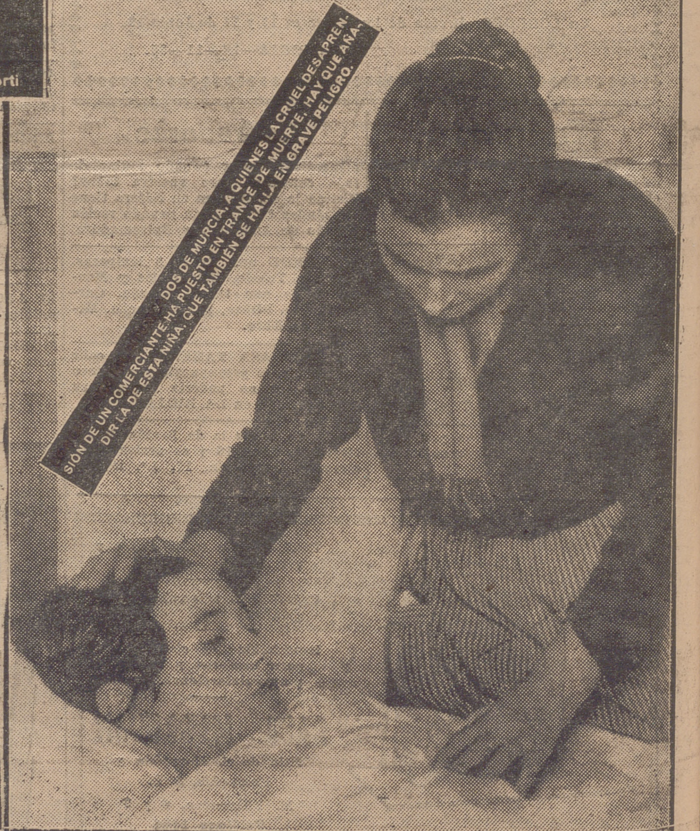
SIOY DE UN COMERCIANTE HA PUESTO EN FRONTE DE SUERTE HA QUE AMA DIR LA DE ESTA NINA QUE TAMBIEN SE HALL EN GRAVE PELIGRO.