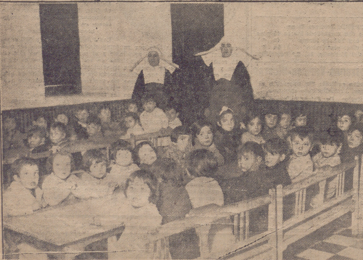
COMEDOR Y SALA DE ESTAR DE LA CASA CUNA DE SANTA ROSA DE ESTA CAPITAL. CUYA RESERVA LITERARIA PUBLICAMOS EN OTRO LUGAR DE ESTE NUMERO