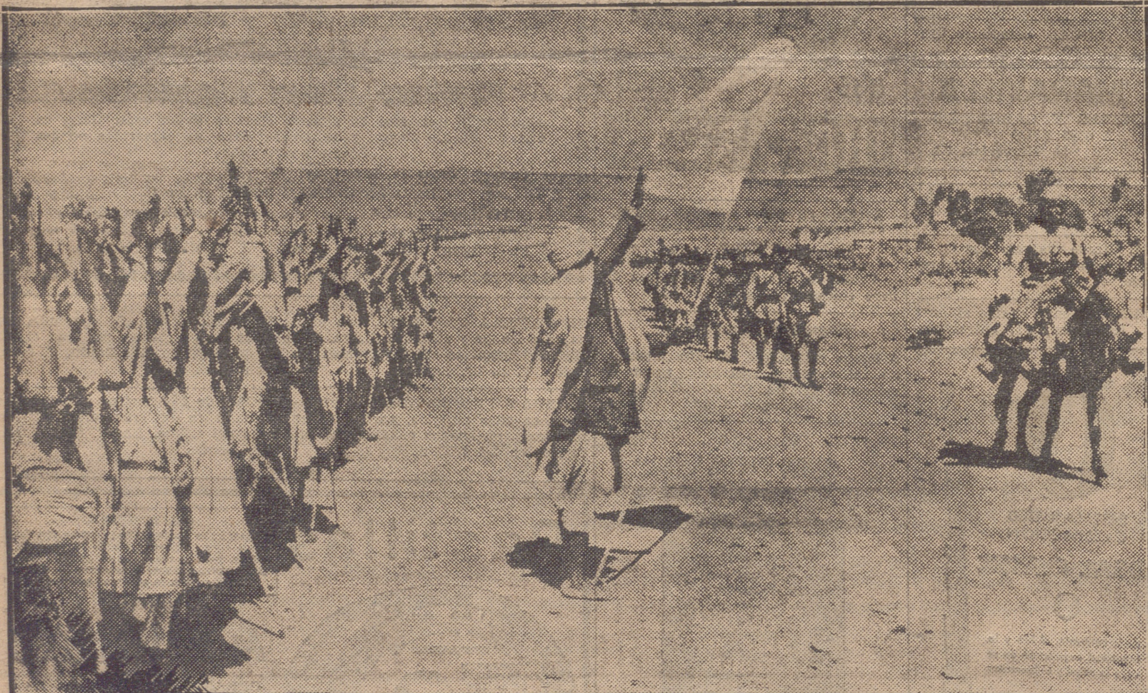
HE AQUI UNA INTERESANTE INSTANTANEA DE LA ENTRADA DE LAS PRIMERAS TROPAS ITALIANAS - UNA COMPAÑIA DE ÁSKARIS - EN LA POBLACION DE MAKALÉ, EN EL TIGRÉ. OBSÉRVESE EL CRUPO DE INDÍGENAS QUE SALUDÁ A LA ROMANA A LAS FUERZAS DE OCUPACION.