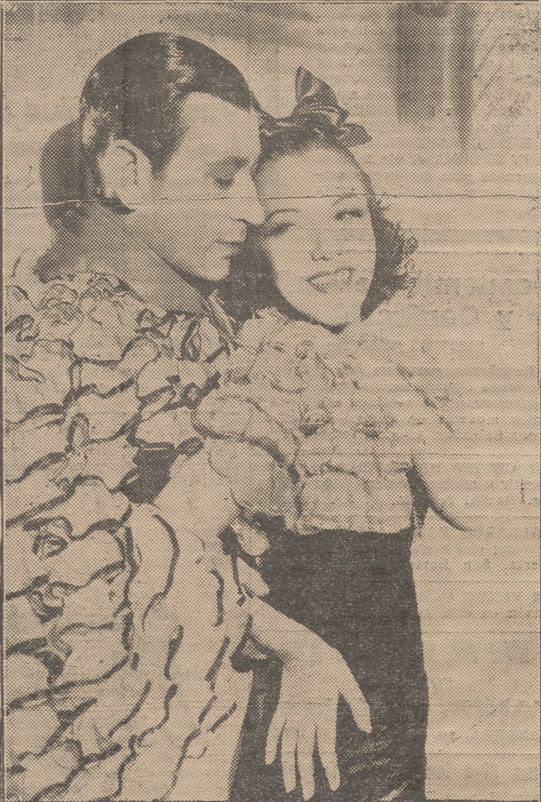
GEORGE RAFT Y CAROLE LOMBARD EN UNA ESCENA DE LA MAGNIFICA PELICULA RUMBA QUE SE PROYECTARÁ HOY EN LOS SALONES Social, Moderno y Beti-Jai