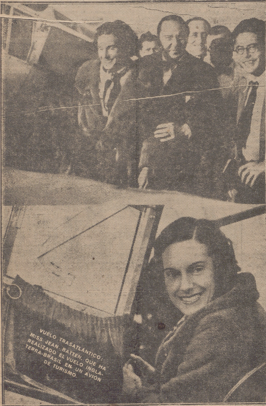
VUELO TRASATLÁNTICO: MISS JEAN BATTEN, QUE HA REALIZADO EL VUELO INGLA-TERRA-BRASIL EN UN AVION DE TURISMO.