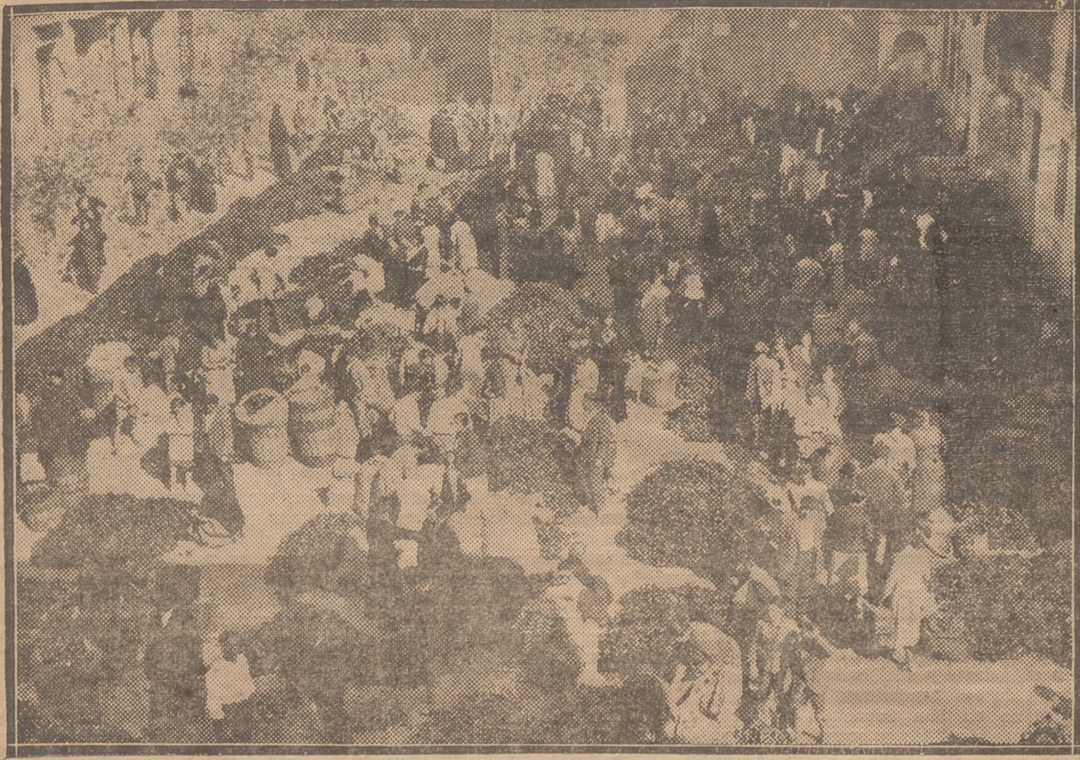
EL MERCADO DE PIMIENTOS.—TODOS LOS MARTES Y VIERNES, EN ESTA EPOCA, PRESENTA ESTE ASPECTO LA PLAZA DE MENDIZABAL, EN LA QUE LA POBLACION ADQUIERE LOS SABROSOS PIMIENTOS RIOJANOS EN GRANDES CANTIDADES, HACIENDO PRO-VISIONES PARA EL INVIERNO