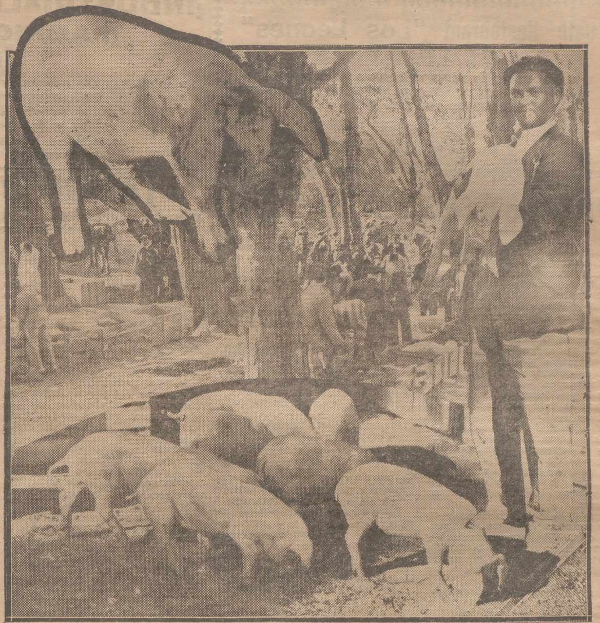
EL MERCADO DE CERDA.—HE AQUI COMO SE ANIMO AYER, SEGUN ES COSTUMBRE TODOS LOS VIERNES, LA CAMPA DE SAN FRANCISCO, DONDE SIN MAS ESTIMULO QUE LA CONCUERENCIA DE VENDEDORES Y COMPRADORES, SE HACEN MUCHOS TRATOS DE TETONES QUE "EN SU DIA" SERVIRAN PARA SURTIR LAS DESPENSAS DE LOS AGRICULTORES DE LA COMARCA