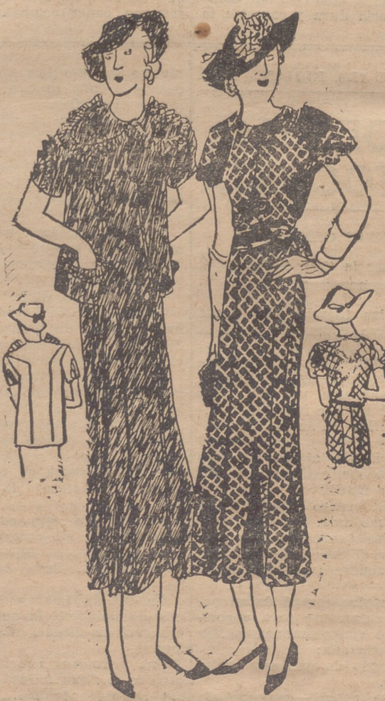
Conjunto en "taffetas" azul marino. Falda ensanchada por dos grupos de pliegues. Chaqueta corta y ancha; se adorna por pliegues en el cuello, mangas y bolsillos. — Traje en "taffetas" cuadrículado en azul y amarillo. La abertura del centro de la espalda está encuadrada por un volante en forma de concha y parece continuarse hasta el grupo de godets, que da amplitud a la falda. El mismo volante adorna el borde de las mangas.

Para conservar frescas las flores cortadas, no hay más que meter los tallos en agua caliente; las rosas pueden soportar la temperatura del agua hirviendo. Cuando el agua se enfría se echa un poco de bicarbonato de sosa y de este modo se logra que las flores estén frescas lo menos quince días.