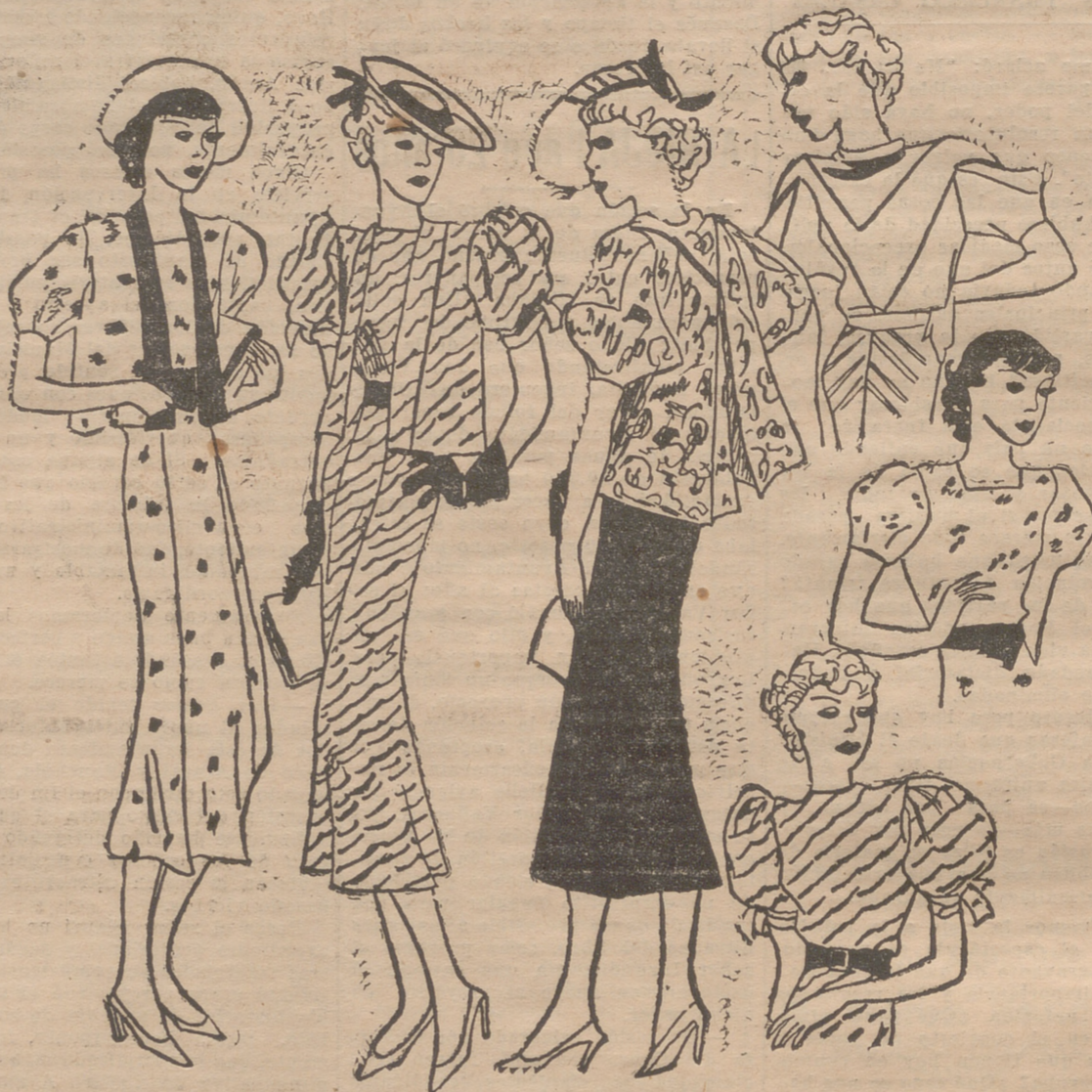
Conjunto de "crepé" blanco impreso de flores multicolores. Cinturón de terciopelo negro abotonado atrás. Vueltas de la chaqueta del citado terciopelo. — Conjunto de "crepé" blanco, impreso de festones negros. El escote de la blusa ajustado al cuello, se abotona en la espalda, donde queda abierto. Cinturón de grueso crepón verde. — Conjunto cuyo vestido es de crepón negro. Cansú de terciopelo verde drapado, formando punta adelante en cuadro, detrás la espalda desnuda. Chaquetita en crepón blanco impreso de flores multicolores