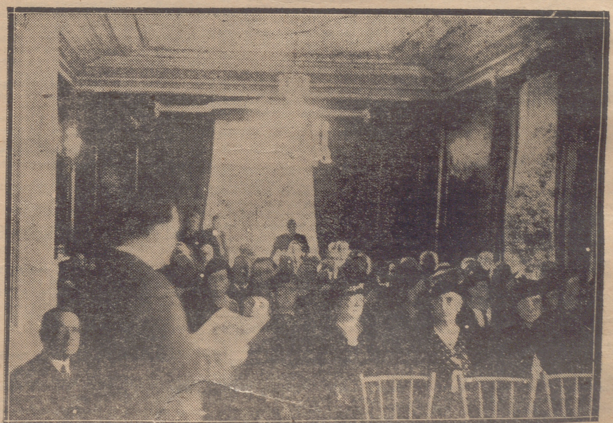
UN ASPECTO DEL SALÓN DE ACTOS DEL PALACIO PROVINCIAL DURANTE EL HOMENAJE CELEBRADO EL DOMINGO.