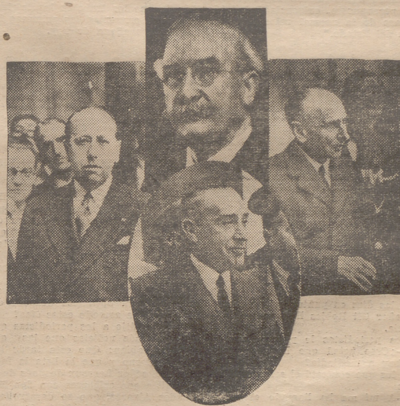
LOS CUATRO JEFES DE LOS PARTIDOS QUE INTEGRAN EL NUEVO GOBIERNO

—S. E. me ha llamado para enterarse de algunos extremos que en mi nota de ayer no quedaron suficiente-