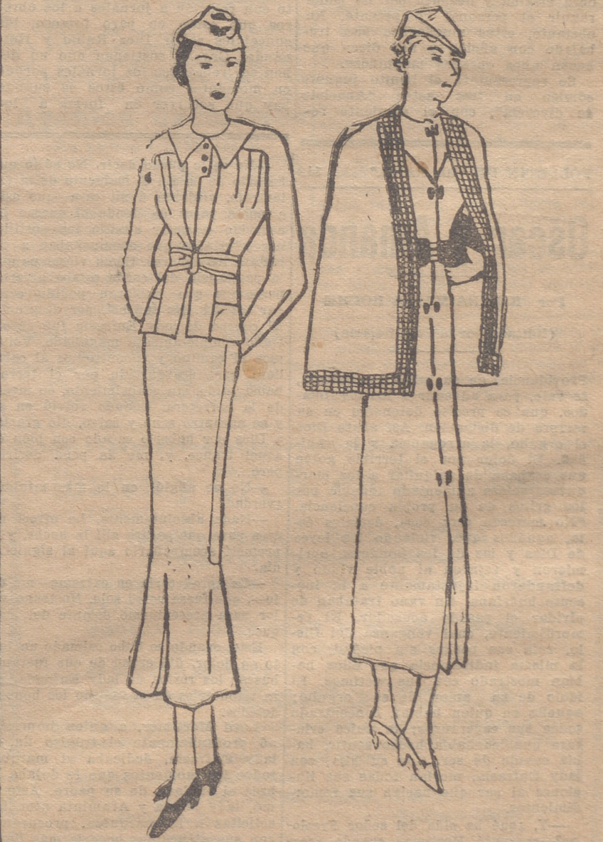
Trajecito sastro de franela gris cuadrículada del mismo tono. Blusa de piqué blanco. Botones de cristal. Cinturón del mismo tejido. — Conjunto de lana color tabaco. Clips de madera color marrón.