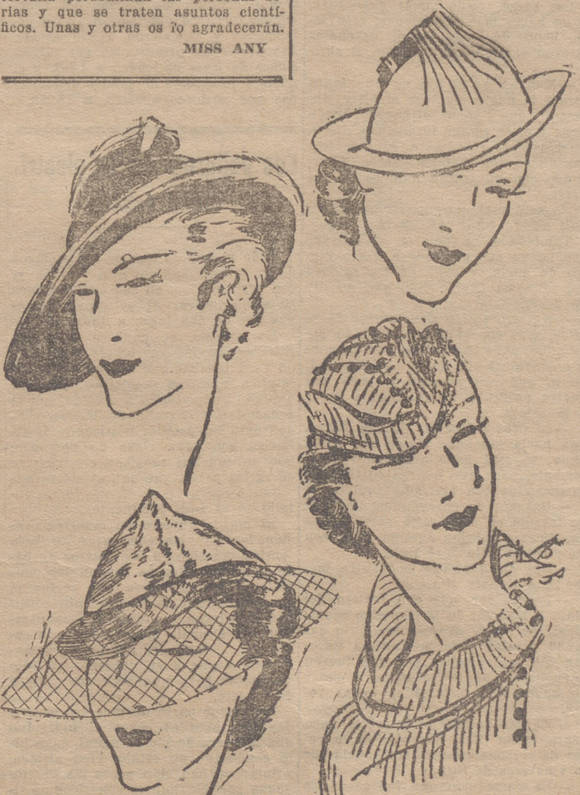
Fletero negro, adornado con una pluma de gallo, color bronce. Casco en "grabe" natural, adornado con un tul negro. — Sombrero de fletero rojo, rodeado con cinta de charol negra. Gorro de jersey, haciendo juego con la blusa.

La risa de la mujer resignada ablandaría las piedras.—Idem.