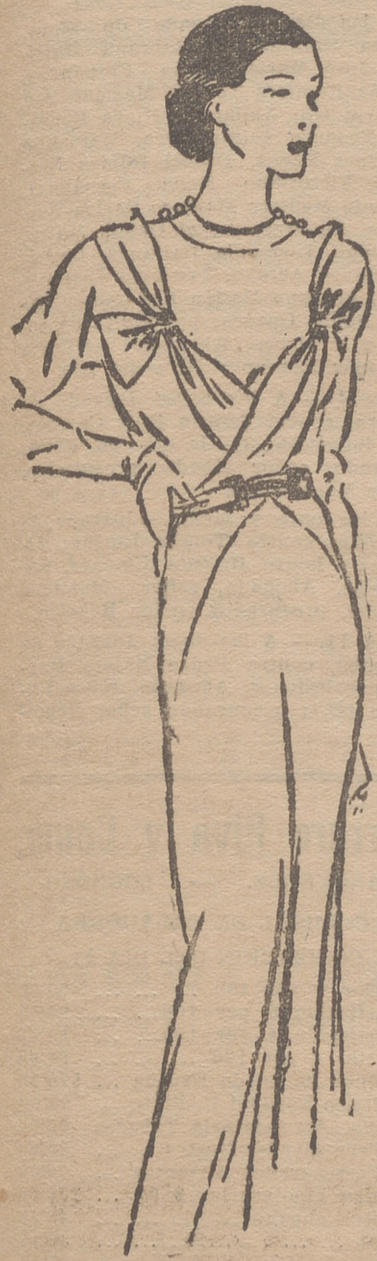
Vestido de tarde de antilope, adornando la cintura con abillanas de fantasía.

ra nosotras mismas, por el placer íntimo y coquetón de contemplarnos, y ésta es la razón de que las más sutiles muestras del ingenio y el cuidado modisteril de ahora se pongan hoy en esas vaporosas prendas que solo el esposo y el espejo ven en la confortable intimidad.