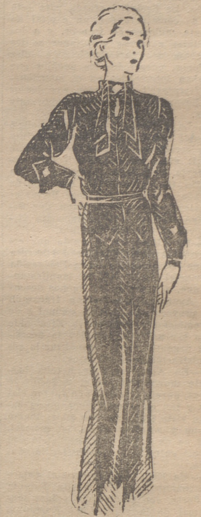
Vestido de mañana, de gamuza gruesa, en tonos nuevos

la mayoría de las mujeres. Es algo especial; un verdadero peinado elegante que se presta a maravilla para arreglarse en casa. Sólo requiere un poco de paciencia y aprender a cepillar el pelo en la dirección que deba seguir. Ejercitándose un poco y dedicándose con regularidad por la mañana y por la noche a cepillar el pelo, pronto se hará fácil que los rulos queden en su lugar preciso.