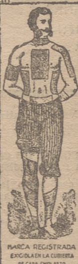
MARCA REGISTRADA EXIGIR EN LA CUBIERTA DE CADA EMPLASTO

Pida usted siempre un EMPLASTO WINTER con ésta marca en la cubierta.