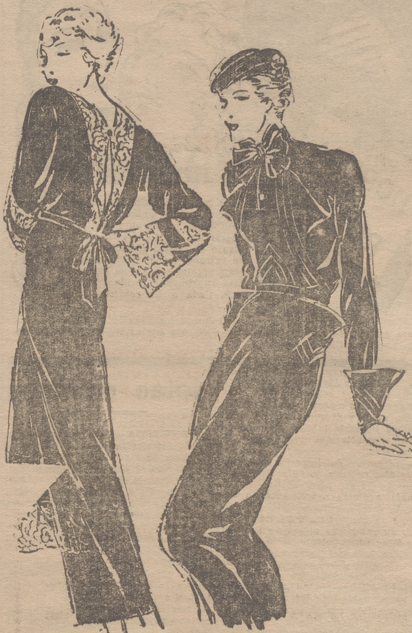
Vestido de djalap negro y puntilla, adornado con un lazo en la cintura, color rubí. — Vestido de djersa, adorna do con nervaduras verde crudo y botones negros.

Con gran tacto y diplomacia procuraba que ninguno de sus contertulios se aislara de la conversación general, y si sucedía alguna vez y comprendía que ese aislamiento era debido al temor de mezclarse en lo que no podía discutir, por no entenderlo, se dirigía a él de vez en cuando para que no hiciera un papel desairado,