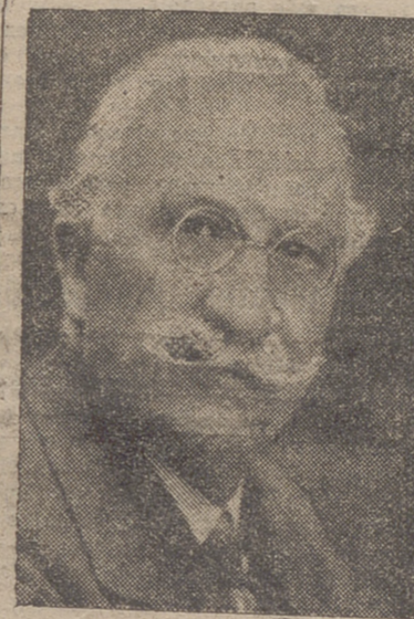
El jefe del Gobierno, señor Lerroux, que hoy cumple 70 años

La reunión de los ministros terminó a la una de la tarde.