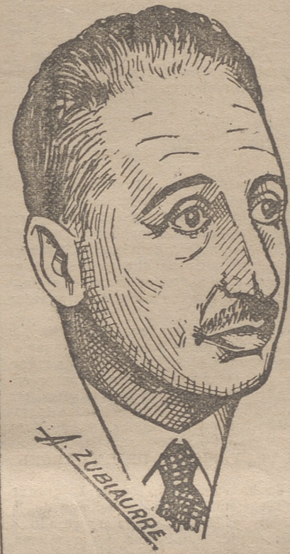
El señor Companys