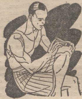
Reuma - Clática Golpes

Preparado en forma de una barrita de facilísimo empleo. Se aplica rápidamente tal como se presenta y sin tener que ensuciar-se las manos.