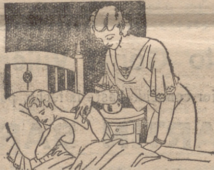
Resfriados - Asma - Pneuresias Congestión pulmonar