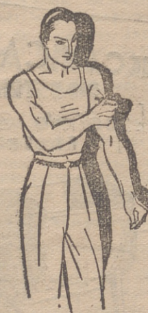
Fatiga muscular Golpes-Torceduras