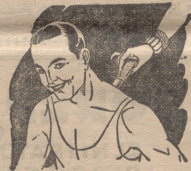
Rigidez del cuello Torticollis