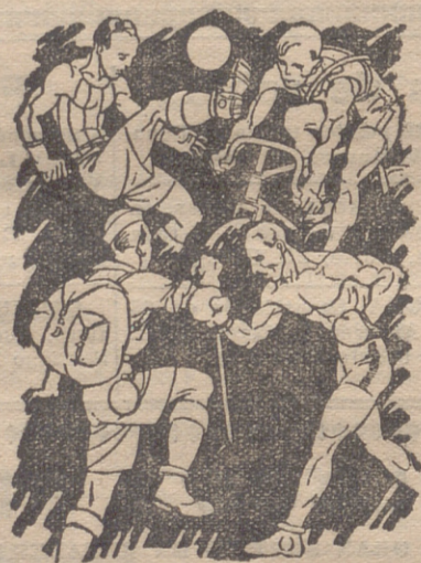
Indispensable para toda clase de sports. No ocupa sitio ni es frágil