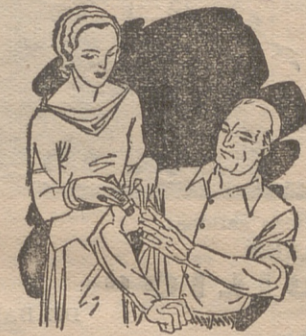
Dolor en las articulaciones Calambres

No ocupa sitio Desconggestion sin irritar No ensucia No tiene mal olor