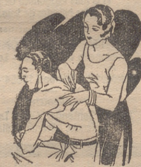
Artrismo Dolores de muñeca y brazos Dolores de espalda y riñones

El LAPIZ TERMOSAN se vende en todas las Farmacias y Centros de Especificos Tubo grande; 4.45 ptas. - Tubo pequeño; 3.- ptas., timbres incluidos