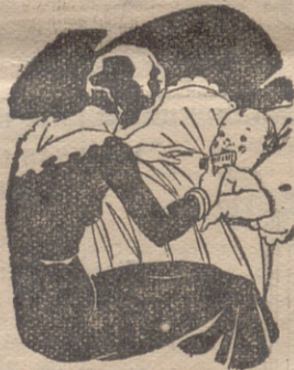
Tos - Catarros - Bronquitis Congestiones