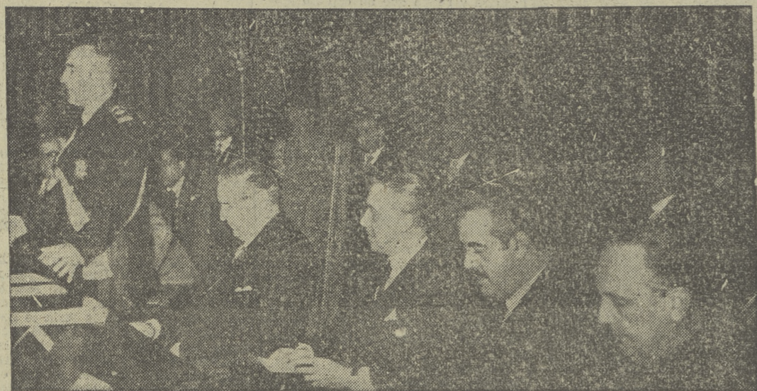
En la Escuela de Ingenieros Agrónomos se celebró el acto de la imposición de la Gran Cruz de Isabel la Católica al ministro de Agricultura, quien pronunció un discurso ante los ministros y personalidades asistentes al acto.