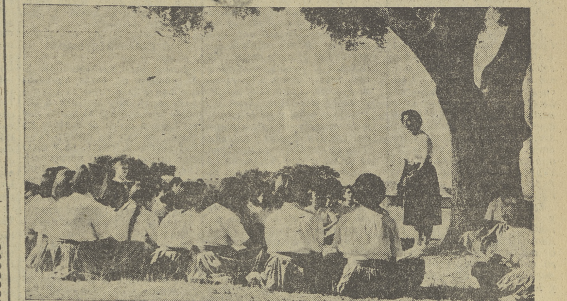
Fotografía de las niñas que asisten a los Albergues de Juventudes.

gente importante en el desenvolvimiento económico nacional.