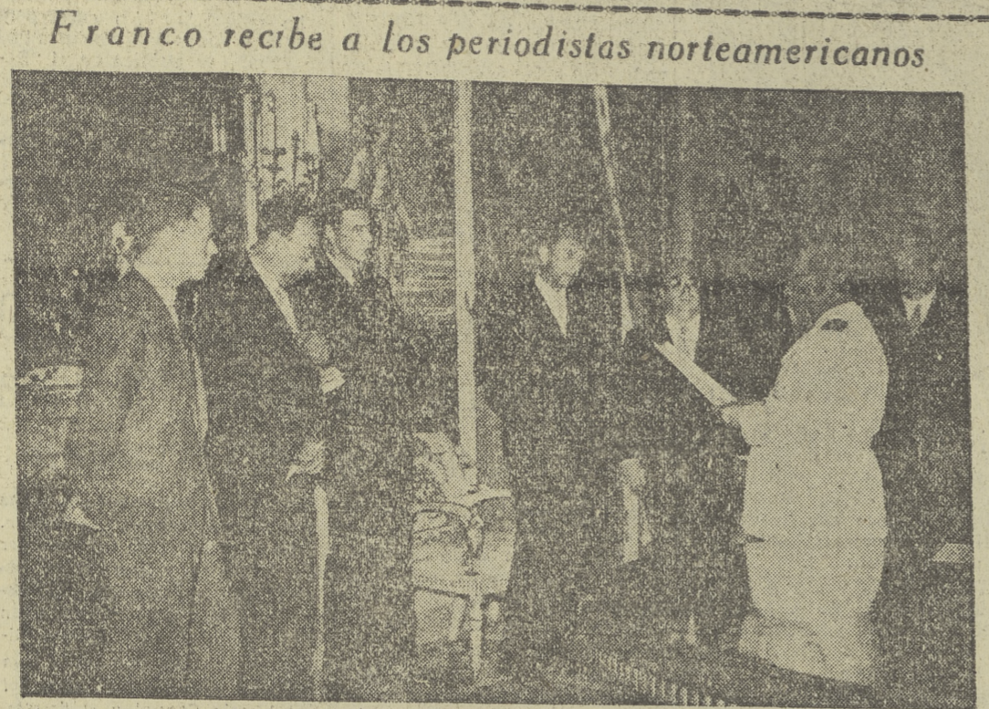
Francisco recibe a los periodistas norteamericanos.

Londres, 8. — El jefe comunista indochino, Ho Chi Minh, ha indicado a Francia, abiertamente, que así no frustra la política norteamericana en Asia, pueden paralizarse las negociaciones del alto el fuego en Indochina. El jefe rebelde ha dirigido esta declaración al jefe del Gobierno francés, Mendes-France, en una entrevista que ha celebrado con el director del Servicio de Información comunista en Indochina, que ha sido difundida por la Agencia de Pekín «Nueva China». En su declaración Ho Chi Minh saluda con satisfacción el discurso de investidura del primer ministro francés y dice que podría llegarse rápidamente a un alto el fuego, pero advierte: «Tenemos que frustrar la política de los imperialistas norteamericanos de obstaculizar y minar la Conferencia de Ginebra, con el fin de materializar rápidamente un alto el fuego en Indochina.» Ho Chi Minh ha añadido que el progreso hacia la paz de Indochina en la Conferencia ginebrina es un poco lento, aunque las negociaciones han preparado el terreno para el establecimiento de la paz indochina.—Efe.