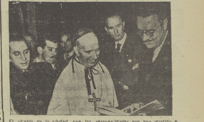
El alcalde de la ciudad, con las personalidades que han acudido a la Semana Social.