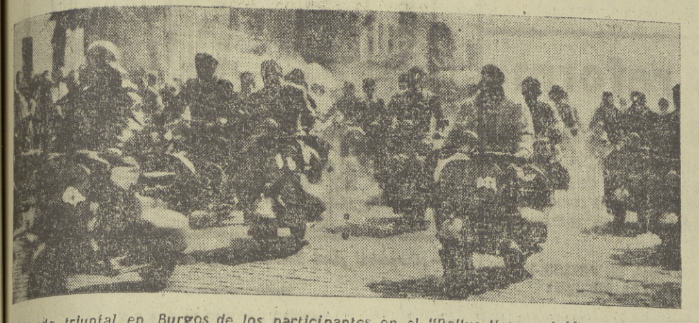
Entrada triunfal en Burgos de los participantes en el "Rallye Vespa al Mar Cantábrico"

Reanuda su marcha el "Rallye Vespa al mar Cantábrico"