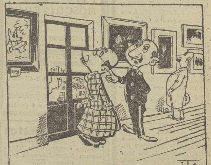
—Caballero, le advierto que esto es el balcón.