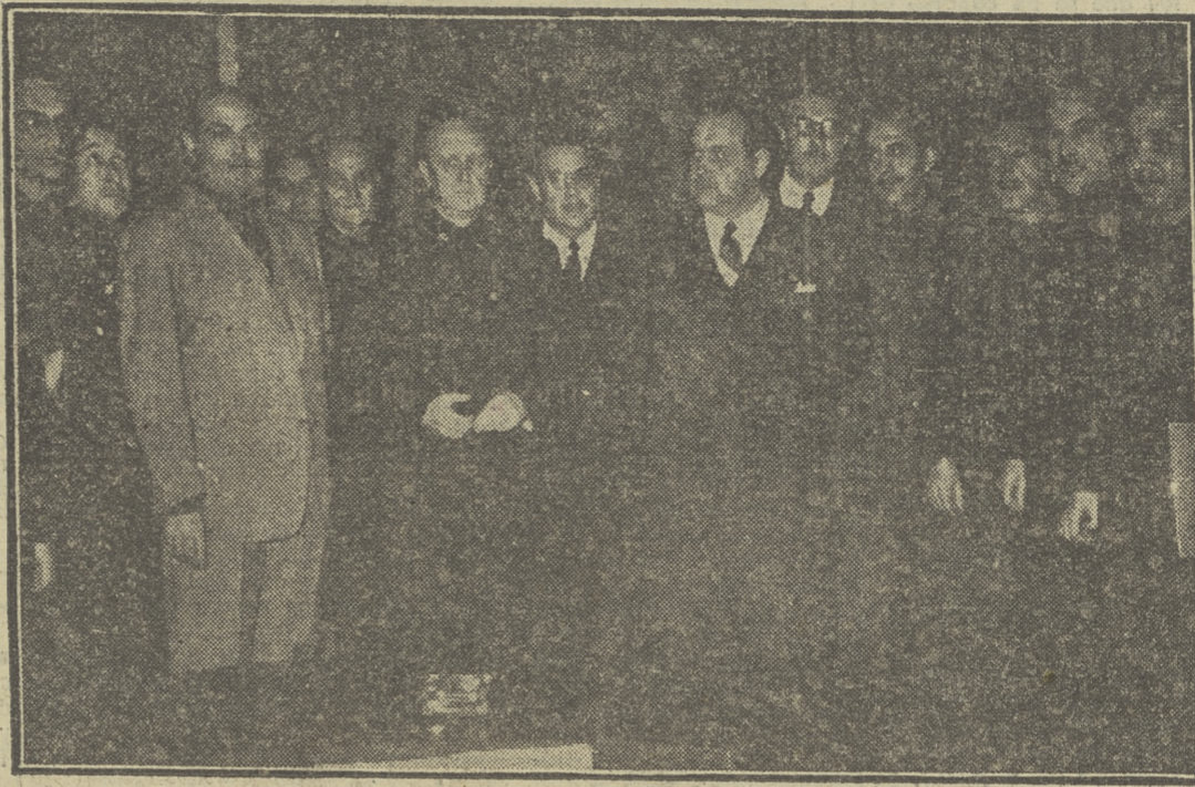
El Ministro Secretario General del Movimiento, Raimundo Fernández Cuesta, con el Delegado Nacional de Sindicatos, en el acto de dar posesión a los nuevos jefes nacionales de Sindicatos, celebrado en la Delegación Nacional.

Toman posesión los nuevos mandos sindicales