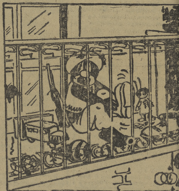
—¡Ahora voy, Majestad; un momento...!