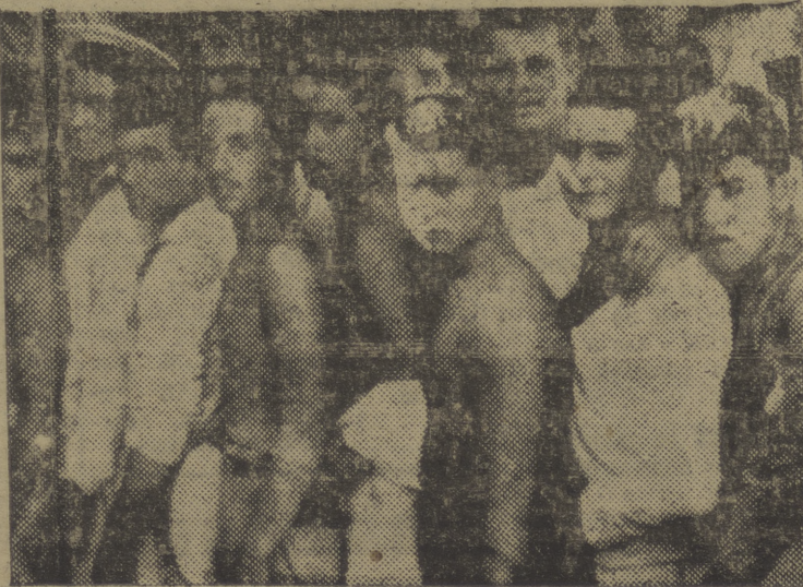
Los marinos españoles del buque-escuela "Juan Sebastián Elcano" esperan turno para donar su sangre, destinada al Banco de Sangre del Instituto del Quemado de la Fundación Eva Perón en Buenos Aires

PAMPLONA, 5. -- La Sección Femenina va a celebrar en Pamplona su Congreso Nacional anual, según se anuncia hoy. Se desarrollará del 13 al 21 del presente mes, con más de 170 delegadas, secretarías y algunas regidoras. Presidirá las sesiones del Congreso la delegada nacional, Pilar Primo de Rivera. La sesión de apertura tendrá por escenario el palacio de la Diputación Foral, y las de trabajo, en un salón de la Escuela da Comercio. El acto de clausura se celebrará en el Castillo de Javier y será presidido por el ministro secretario general del Movimiento, señor Fernández Cuesta. Las conferencias estarán a cargo de Pilar Primo de Rivera, fray Justo Pérez de Urbel, el señor Solís Ruiz y el señor Fernández Cuesta. (Efe).