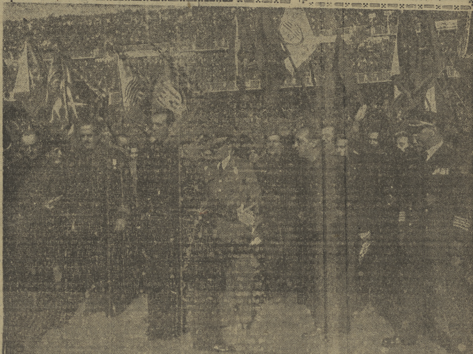
En esta foto se ven dos momentos de la gran concentración falangista del día 29. Arriba, el Jefe del Estado y Jefe Nacional de la Falange saluda a los ministros de su Gobierno. Abajo, escoltado por el entusiasmo delirante, llega al Estadio de Chamartín.