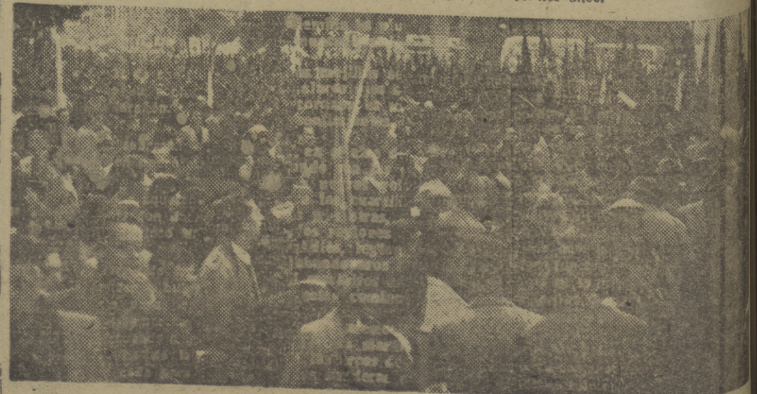
IMPONENTE MANIFESTACION FALANGISTA Una vez finalizado el acto de concentración falangista en el estadio de Chamartín bajo la presidencia del Caudillo, se organizó una imponente manifestación, que se dirigió a la Secretaría General del movimiento, desde donde el ministro secretario, camarada Fernández Cuesta, les dirigió unas palabras.