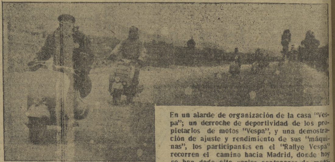
En un alarde de organización de la casa "Vespa"; un derroche de deportividad de los propietarios de motos "Vespa"; y una demostración de ajuste y rendimiento de sus "máquinas", los participantes en el "Rallye Vespa" recorren el camino hacia Madrid, donde hoy se han dado cita varios centenares de motocicletas que montan "Vespa". -- (Información, en la página once.)

En partido preliminar para el Campeonato Mundial de Fútbol Inglaterra ha vencido al País de Gales por cuatro a uno. El primer tiempo terminó con empate a uno.