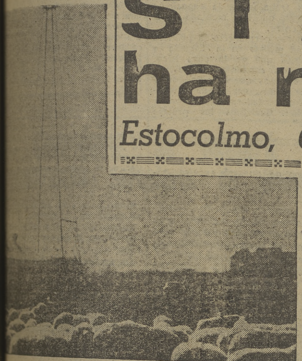
Una vista panorámica del campo de trabajo en Marcilla (Navarra), donde se realizan sondos petrolíferos. En primer término un rebaño de vacas, y al fondo, la torre de 54 metros, que contrasta con esta estampa bucólica.

La Prensa de todo el mundo ha especulado ampliamente en relación con la muerte de Stalin. Así, los periódicos de la cadena norteamericana "Scripps-Howard", dicen que el dictador logró el puesto por medio de la intriga y el asesinato, matando a la mayor parte, si no a todos, de sus primitivos amigos y correligionarios. Nuestra mejor garantía de paz —añaden— es fortalecernos para que su sucesor no se sienta impulsado a seguir su camino. Los periódicos socialistas suecos creen que ninguna persona única heredará a Stalin. En Francia preocupa que su sucesor haga peligrar la paz y que las luchas internas comunistas comenciarán de nuevo, y en Inglaterra creen que le sucederá Malenkov, con Molotov de segundo.