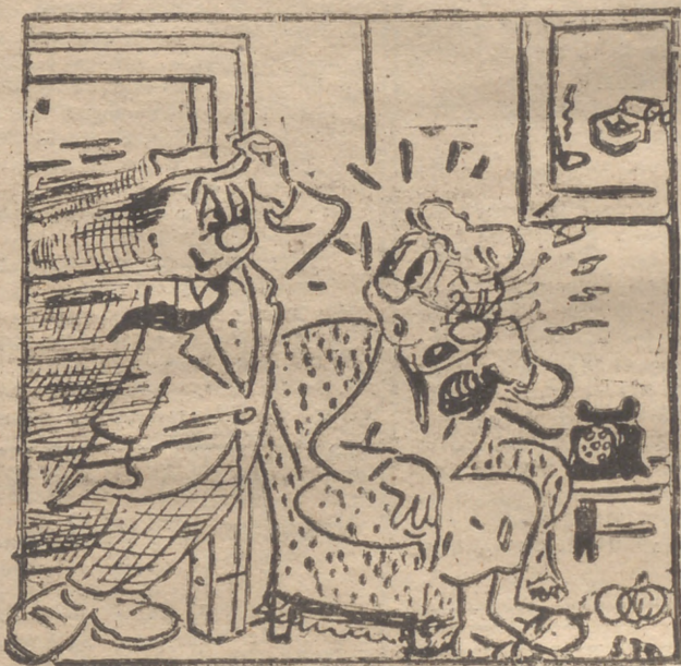
¡Ven Inmediatamente...!! (¿?)