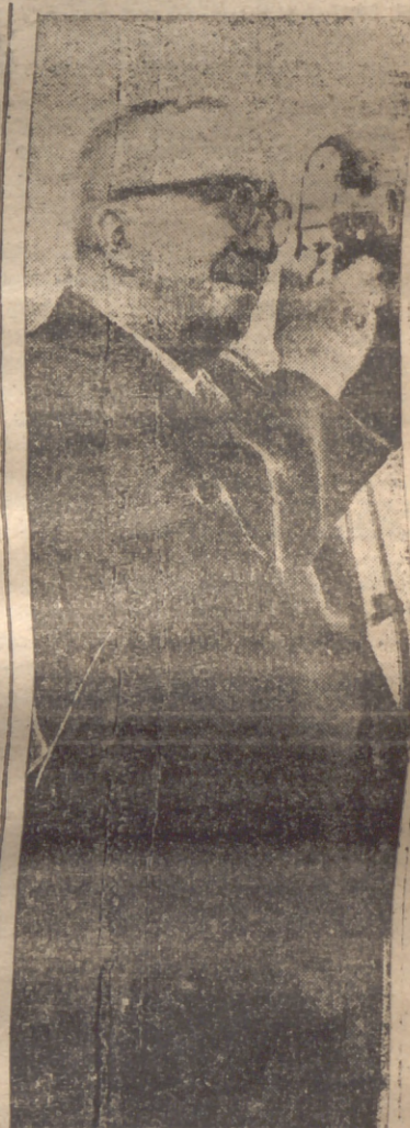
Ernst Heinkel, el famoso constructor alemán de aviones, toma algunas "fotos" de los aparatos que se exhiben en la exposición inglesa de Farnborough, a la que fue invitado y en la que ocurrió el catastrófico que ya conocen nuestros lectores.

SANTIAGO DE COMPOSTELA, 11. — La esposa y la hija del Caudillo han visitado esta ciudad, dirigiéndose a la Catedral, donde fueron recibidas por el alcalde. Al amanecer regresaron al Pazo de Meirás.