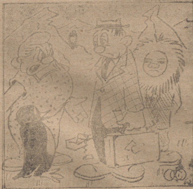
— ¡Te dije que me encantaría veranear en el Norte, pero no tanto...! —