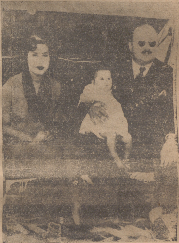
He aquí el rey Faruq con su esposa Narmlen y su hijo Fuad II, en la primer foto, en el exilio, que ya no se presenta tan dorado como podía suponerse, ya que el Gobierno ha reducido en dos tercios la "lista civil" y ha empezado a investigar el origen de las propiedades del ex-rey y la cuantía de los impuestos que dejó de pagar el destronado monarca.