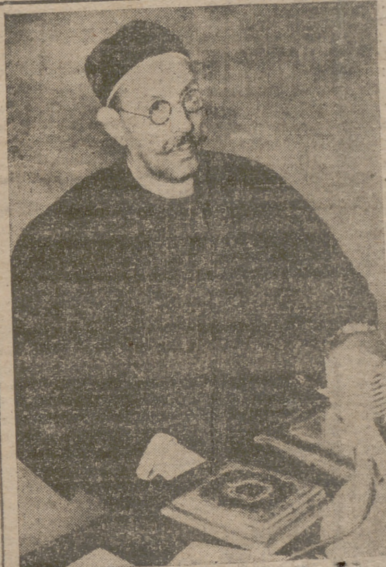
He aquí a Mohamed Idris Al Mahdi A Senussi, nuevo rey de Libia y el último coronado, dirigiendo una alocución por radio a su país, con motivo de las últimas festividades religiosas musulmanas.

Año VIII - Núm. 2.097 | Burgos, Viernes, 27 de Junio de 1952 | Precio: 70 céntimos