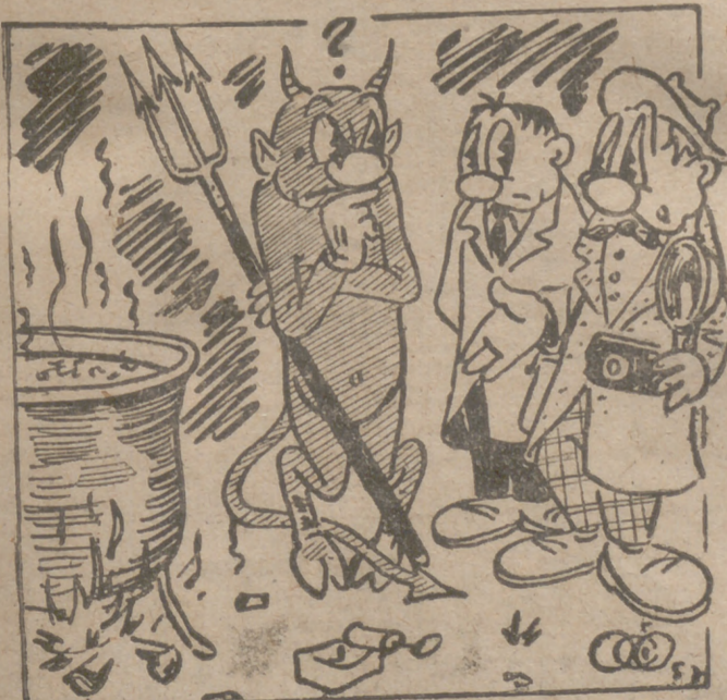
— ¡Nos dijo el director que "nos fuéramos al diablo", pero no sabemos a qué... —