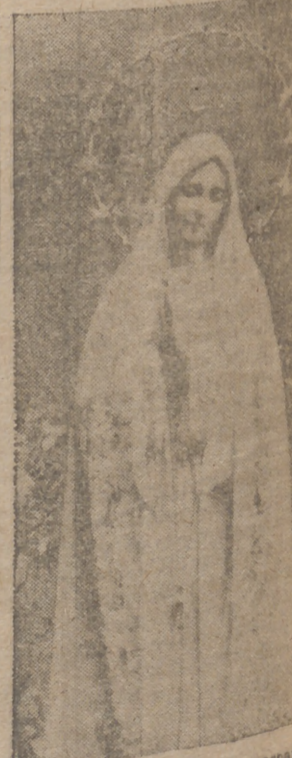
¡Católico burgales, acorralado y comulgat!

La gran promesa de la Virgen de Fatima: "Yo prometo asistir en la hora de la muerte, con las gracias necesarias para la salvación eterna, a todos aquellos que en los PRIMEROS SABADOS DE CINCO MESES CONSECUTIVOS, se comulguen, comulguen, según la tradición, en la compañía de un cuarto de hora, meditando en los quince misterios del Rosario, con intención de darme reparación". (10 de diciembre de 1925, aparición a Luján).