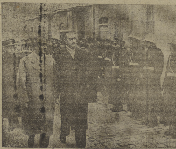
La Guardia Municipal celebró el domingo la fiesta de su Patrono, San Sebastián, conmemorándolo con diversos actos, que reseñamos en páginas interiores. En la fotografía de Villafranca, el gobernador civil y el alcalde pasan revista a los componentes del Cuerpo.

España figura en el presupuesto para el año fiscal 1952-53 presentado hoy por el presidente Truman al Congreso, si bien no se especifican en él todos los fondos destinados para ella, a lo que en los últimos meses se autorizan créditos por valor de unos 174.500 millones. (Efe).