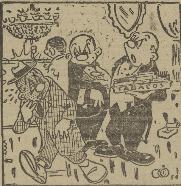
--¡Me ha dicho que si tenía "Diana"!--