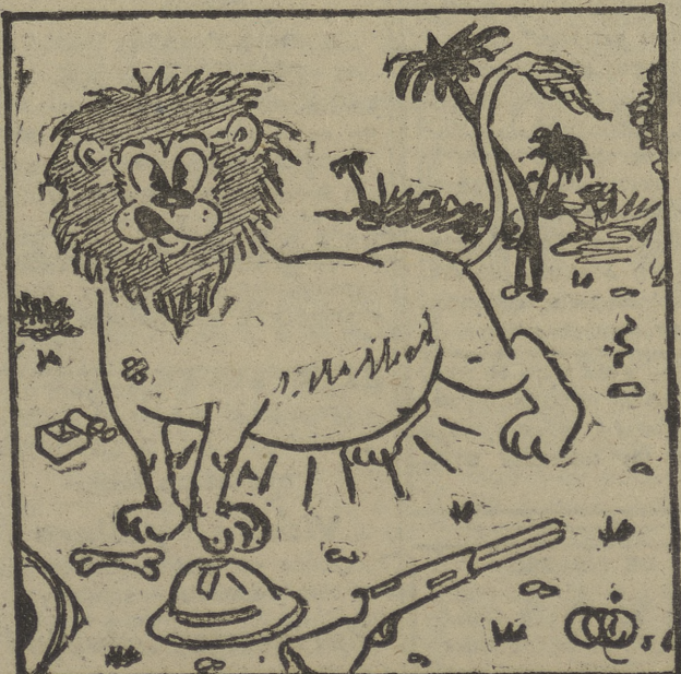
—¡ya le decia yo, Pepe, que ese rille tallaba mucho...!