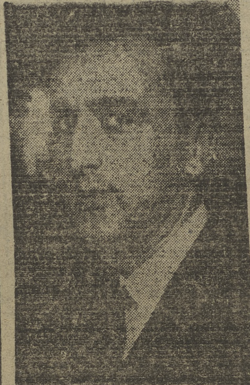
BARAJAS, 31. — En avión, ha salido para Roma, a los 11,50, el ministro de Educación Nacional, don Joaquín Ruiz Jiménez