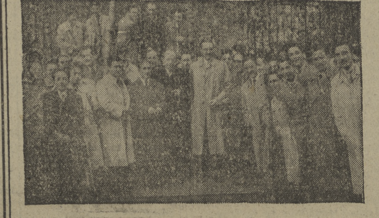
Autoridades, dirigentes sindicales y productores a la salida de la misa celebrada por el Sindicato Provincial de Papel, Prensa y Artes Gráficas en honor de su Patrono, San Juan Ante-Portam-Latinam. — Información en cuarta página.

IRUN, 7. — Con destino a la exposición que la ciudad francesa de Burdeos dedica al famoso pintor aragonés Goya, ha cruzado la frontera, con dirección a Francia, un camión que contiene diferentes cuadros de este pintor. Los lienzos proceden de Barcelona, Bilbao, Madrid, Pamplona, Zaragoza y Zumaya. En esta exposición, que durará desde el 16 de mayo hasta el 30 de junio próximo, figurarán además, cuadros de Goya procedentes de Amsterdam, Berlín, Bruselas, Goye, Detroit, Dublín, La Fere, Nueva York, París, San Luis (California) y Viena. (Efe.)