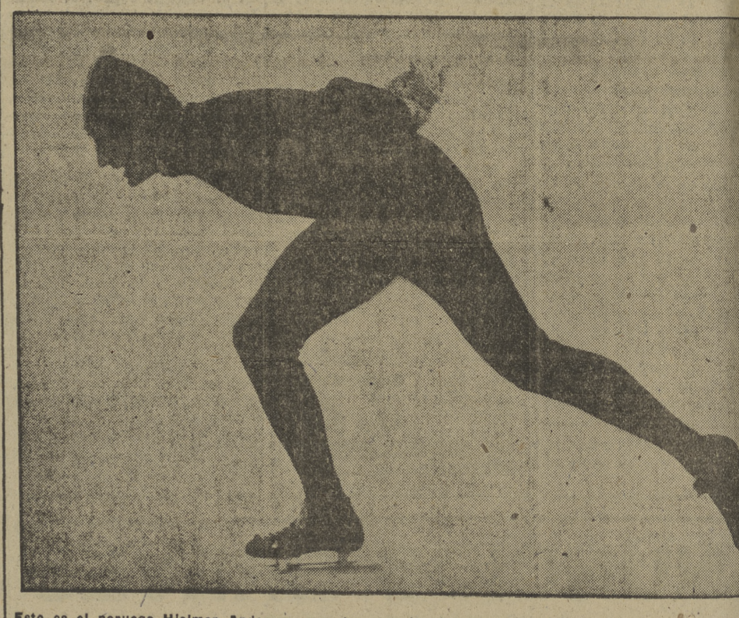
Este es el noruego Hjalmar Andersen, que ha ganado el campeonato del mundo de patinaje en (Suiza). El campeón durante la prueba de los cinco mil metros, que conquistó.