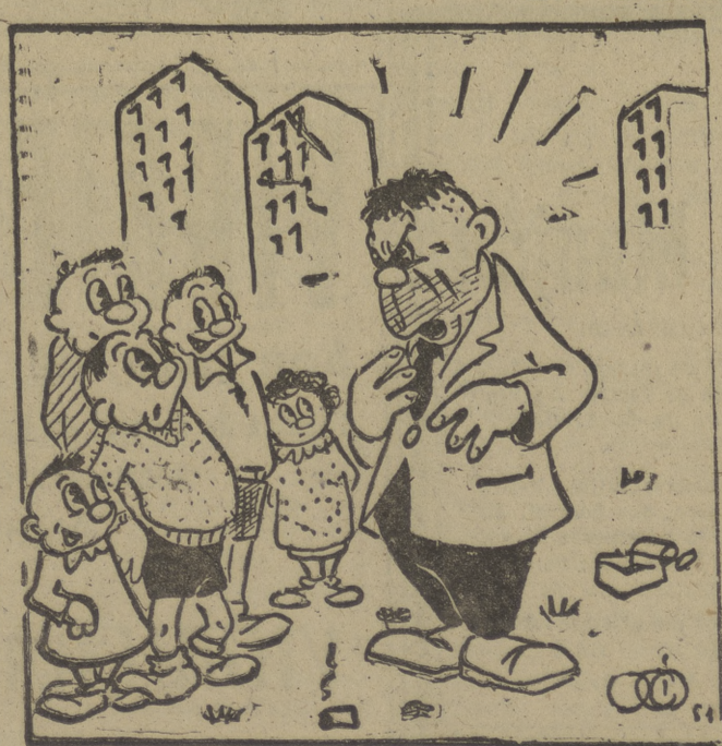
—¿Es que tengo monos en la cara?!