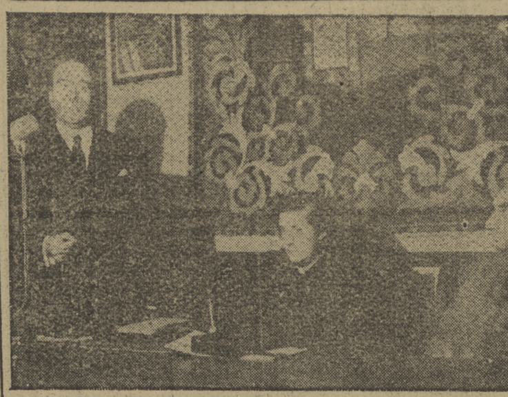
La delegada nacional de la Sección Femenina, con el gobernador militar de Burgos, durante la conferencia del embajador señor Arellano