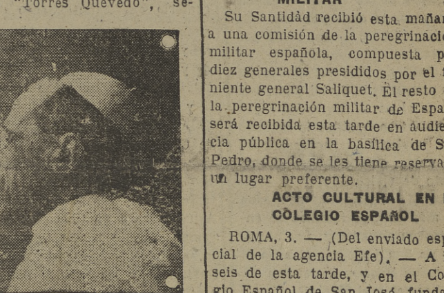
del dogma de la Asunción de la Virgen María y un rosario, y a continuación se dejó fotografiar en grupo con los asistentes. Finalmente, puestos todos de rodillas, impartió la bendición apostólica. Al besarle el anillo en señal de despedida, el ministro de Educación Nacional dijo a Su Santidad: "España, por el Papa", y el Sumo Pontífice contestó: "Y el Papa, por España".