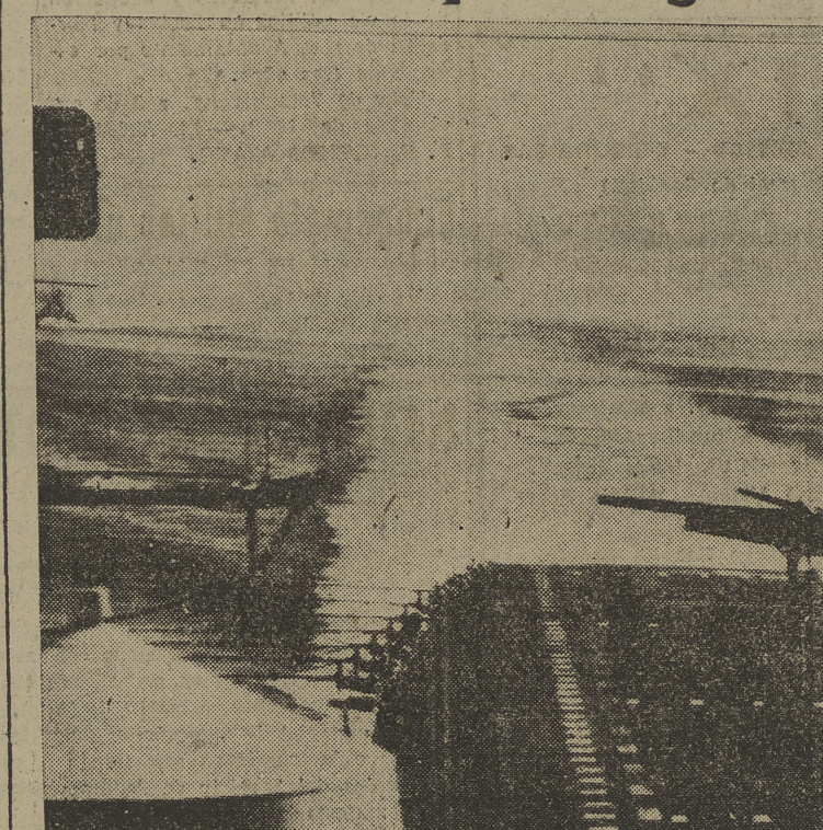
El "AJ-1", el avión de bombardeo más poderoso de los Estados Unidos con base en portaviones, se dispone a despegar del "Coral Sea".

Los pilotos que caigan al mar no podrán ya ahogarse