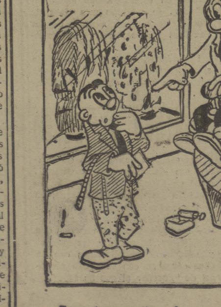
—Tome, tome medidas...!