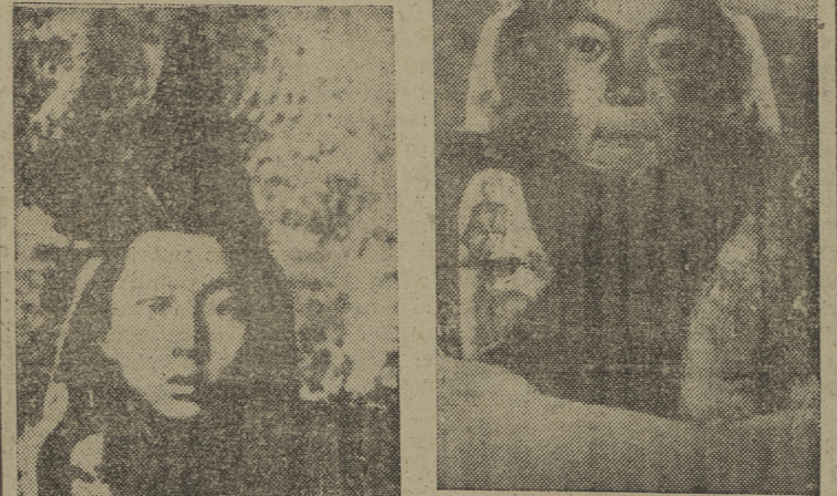
chinos dominan todo el Tibet oriental.

En esta ocasión los dos niños en los que hoy se amparan los dos poderes en el Tibet se enfrentan. El tradicional nacionalista y el comunista. En pro y en contra de la tranquila vida de los Lamas monásticos y misteriosos del "techo del mundo". En primer lugar, el Dalai-Lama, de quince años, que huyó a la India, cosa que no le hace ninguna gracia a Pandit Nehru ni a sus súbditos. Por último, el Pachá-Lama, de la pantalla de Mao, que intenta legitimar de esta manera —hablando de reivindicaciones— una invasión comunista en toda línea.