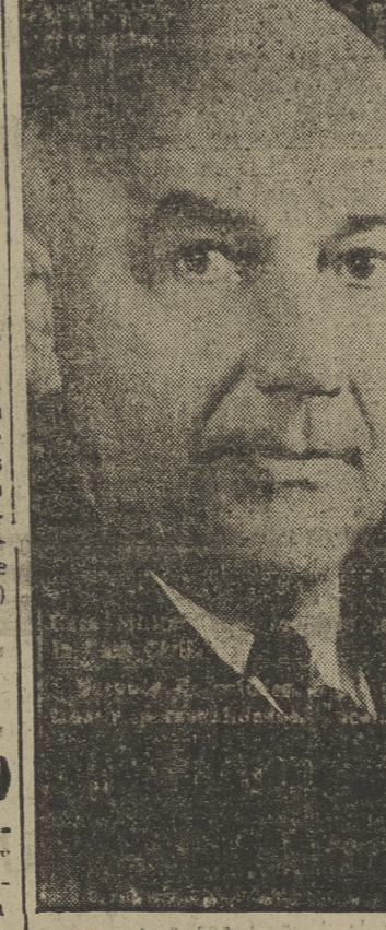
El viceministro norteamericano Arthur Struble, que manda la séptima escuadra de los Estados Unidos, que opera actualmente en aguas de Formosa, la isla donde se halla refugiado Chang-Kel-Chek y que tanto preocupa a Inglaterra, por el temor de que algún día Mao se decida a invadir Formosa y obligue a la VII Flota a intervenir, lo que significaría la guerra con Estados Unidos.

Los morteros rojos están bombardeando la ciudad