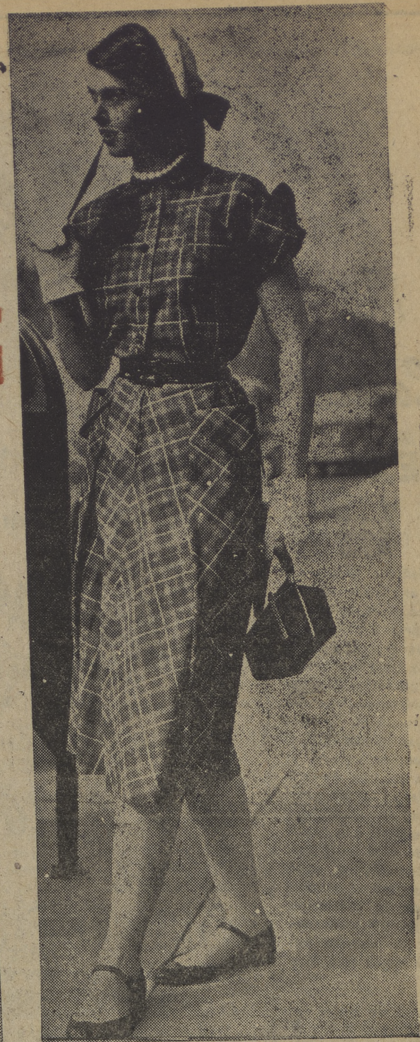
Modelo juvenil de verano con botellas en la blusa y falda, mangas remangadas y cinta de cintura. Primer Premio de Rivera inaugura el albergue de la S. F. establecido en Albarreal.