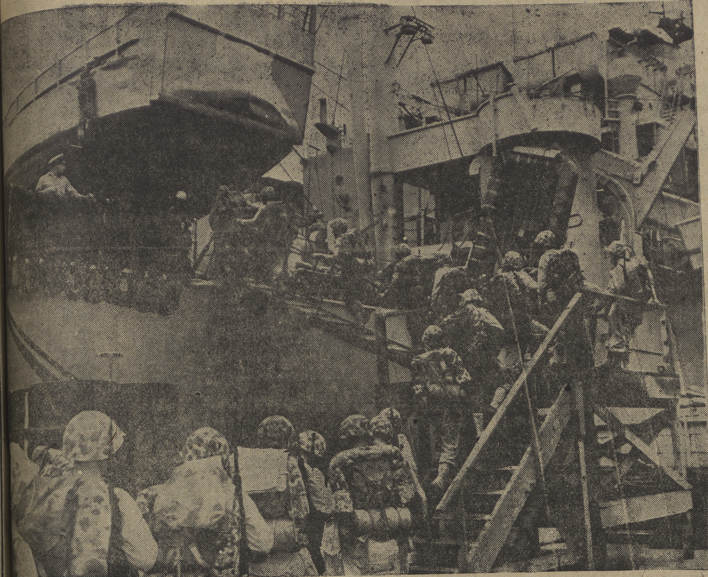
Soldados norteamericanos embarcan en un barco que les conducirá al frente coreano en ayuda de sus compatriotas.