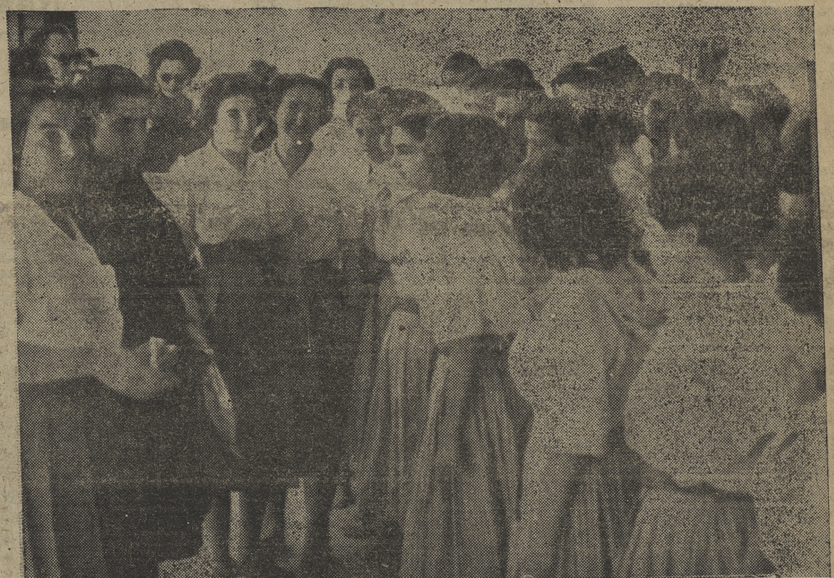
Socios de la Motos de Viajantes y Representantes del Norte de España en su fiesta patronal.