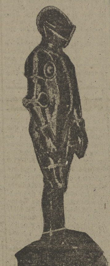
Entre las muchas obras de arte que el Gobierno de Austria ha cedido para que sean expuestas en diversas galerías de arte de Estados Unidos aparece esta armadura del siglo XVI

La fiesta, como ustedes ven, resulta cara. Cogiéndola por las ramas, una muñeca vale cinco mil francos; un tren eléctrico miniatura, ochenta mil. Los niños mitad siglo XX reclaman en sus cartas a Papá Noel microscopios de ochenta mil francos, máquinas de coser con motor, cocinas eléctricas y aparatos de filmar, como nos demuestra el espectáculo de los grandes almacenes de París: TODO CARO