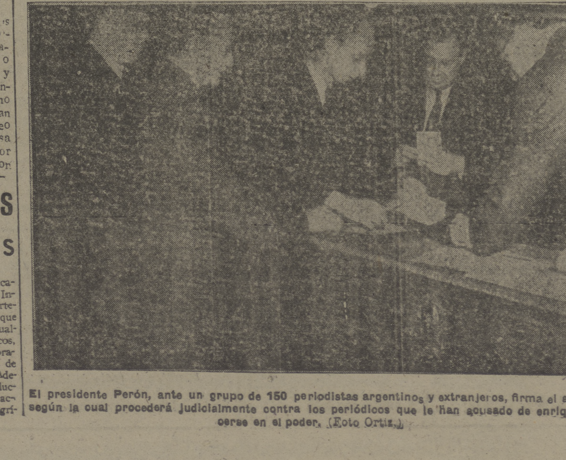
El presidente Perón, ante un grupo de 150 periodistas argentinos y extranjeros, firma el acta según la cual procederá judicialmente contra los periodistas que le han acusado de enriquecerse en el poder.