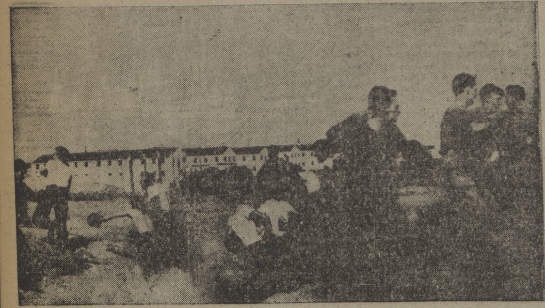
Un nuevo deporte entre los militares norteamericanos. Se trata de un "marathon" mezcla de football, boxeo, campo a través y otras especialidades deportivas. La "foto" recoge un duelo entre un batallón de carros blindados y otro de artillería en Texas.

CRONICAS Y REPORTAJES ESPECIALES PARA "LA VOZ DE CASTILLA"