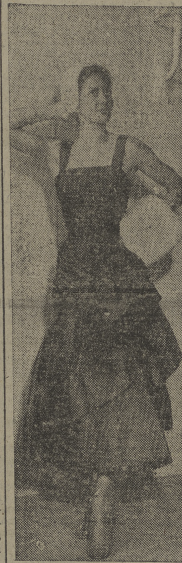
Vestido de noche en tafetán marrón, recogido a un lado con casquete y mangullos de pie: blanco de armillo, de la colección para otoño de Jacques Griffe, en París.

Muchas son las dificultades, ingentes los problemas que hoy presenta una mejora de la producción agrícola y de las condiciones de vida en el campo; pero es indudable que la única forma de acercarse a ellos con posibilidades de éxito reside en esta unidad campesina—cinco millones de productores— que el día 12 se presentará en Madrid, por tercera vez, plena de entusiasmo y de responsabilidad ante sus representantes y ante la masa general del país, que tanto espera del campo en el aspecto económico. Tendremos una Patria fuerte el día que tengamos un campo próspero y agradable, no unas palameras yermas y unos pueblos azotados por el viento de todo un conjunto de desfavorables circunstancias.