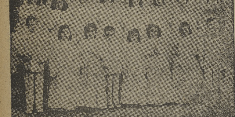
Abajo: Grupo de niños y niñas que ayer hicieron su primera comunión en el Colegio de Concepcionistas...