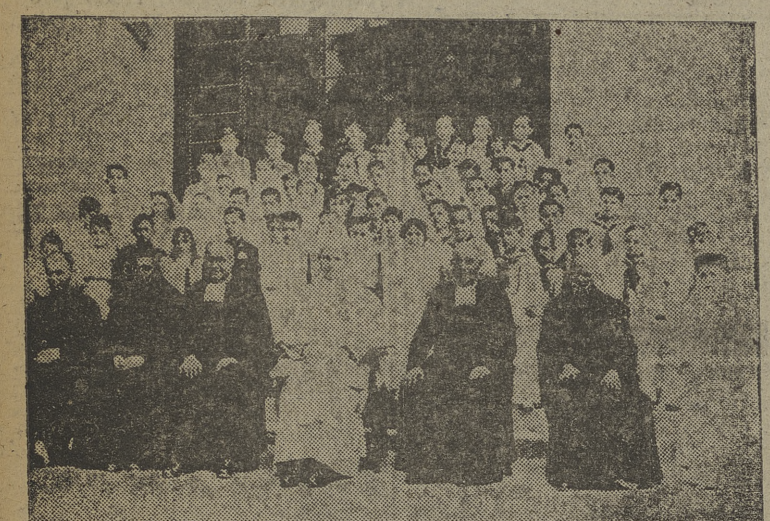
Arriba: El abad mitrado de S. Pedro de Cardena con el director, profesores y alumnos...