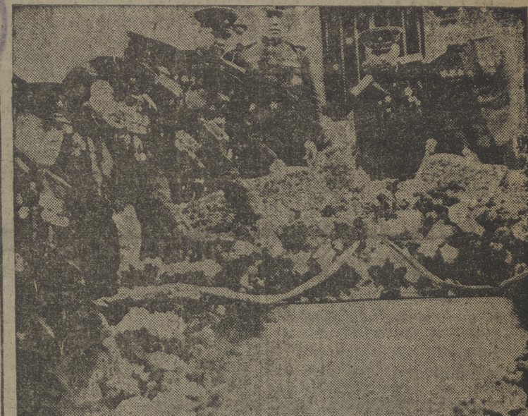
Oficiales soviéticos colocan coronas de flores sobre el nuevo monumento erigido en memoria de los siete mil soldados rusos muertos en la batalla de Berlín. El monumento ha sido construido con mármol de la destruida Cancillería. Dejamos a los lectores el comentario que sugiere la abundancia de cruces y condecoraciones sobre el pecho de los oficiales rusos, que han dejado atrás — en su afición por lo brillante — a sus antecesores zaristas.