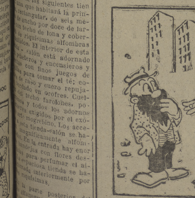
EL -- Veo que se ha quedado usted un poco impresionada al verme... ELLA. -- Pues, sí... Porque me habían dicho que era usted... muy "efectado".