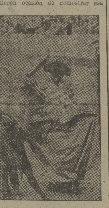
Una chicolina de "Brillante Negro".