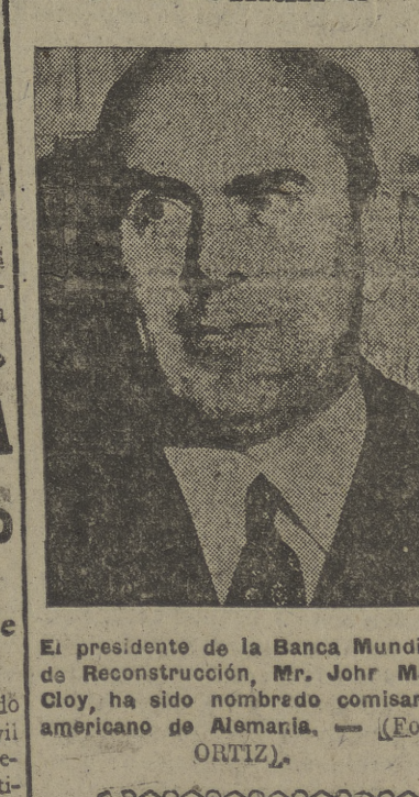
El presidente de la Banca Mundial de Reconstrucción, Mr. John Mac Gloy...