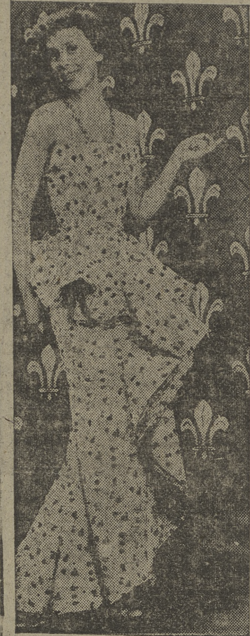
Vestido de noche de Schaparelli que una joven (?) modelo francesa exhibe ante las cámaras televisoras del palacio de Ajajandra, en Londres. El vestido es de organdí con un amplio frunce en espiral por su parte delantera.