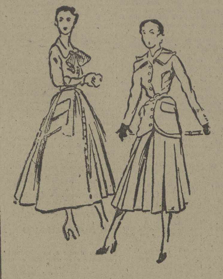
Jersey gris, nudado con tafetán pequinés, y vestido de franela gris