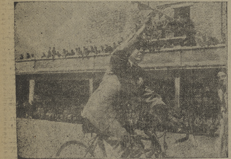
Carrera de cintas en los patios del Liceo Castilla, como parte del brillante programa organizado con motivo de la fiesta del Colegio y homenaje al hermano director.