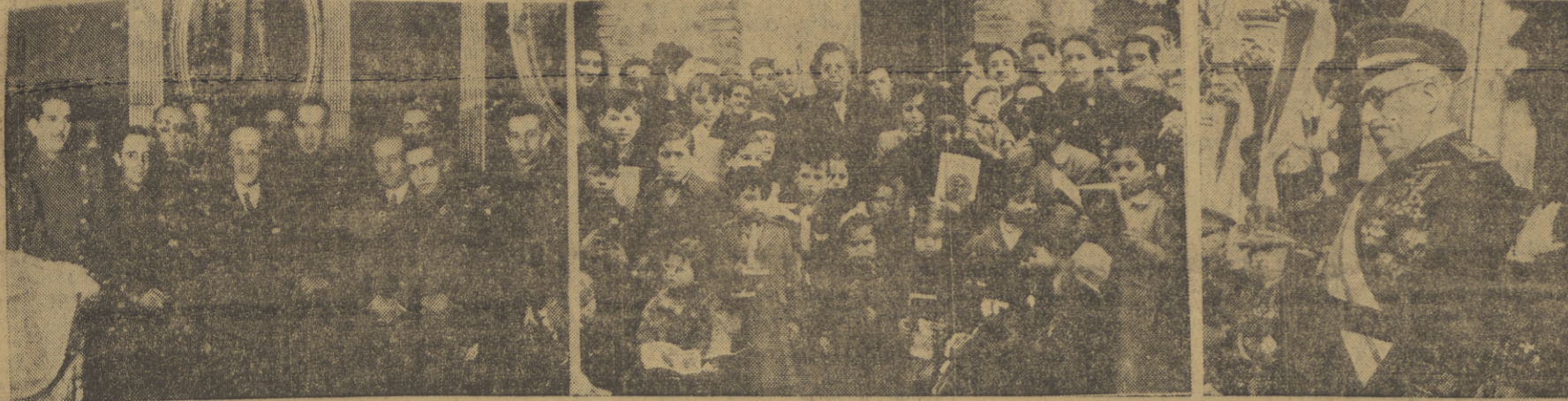
Información gráfica de nuestro fotógrafo Villafranca, de los actos celebrados ayer con motivo de la festividad de los Reyes Magos y Pascua Militar...