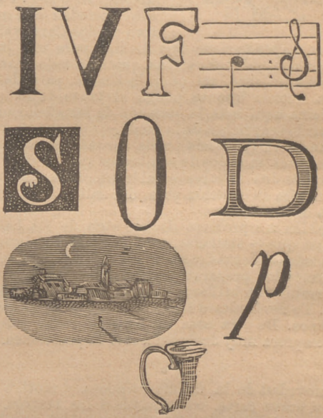
(Las soluciones en el número próximo.)