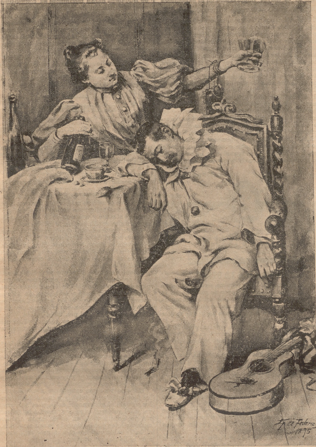
LO QUE SE VE